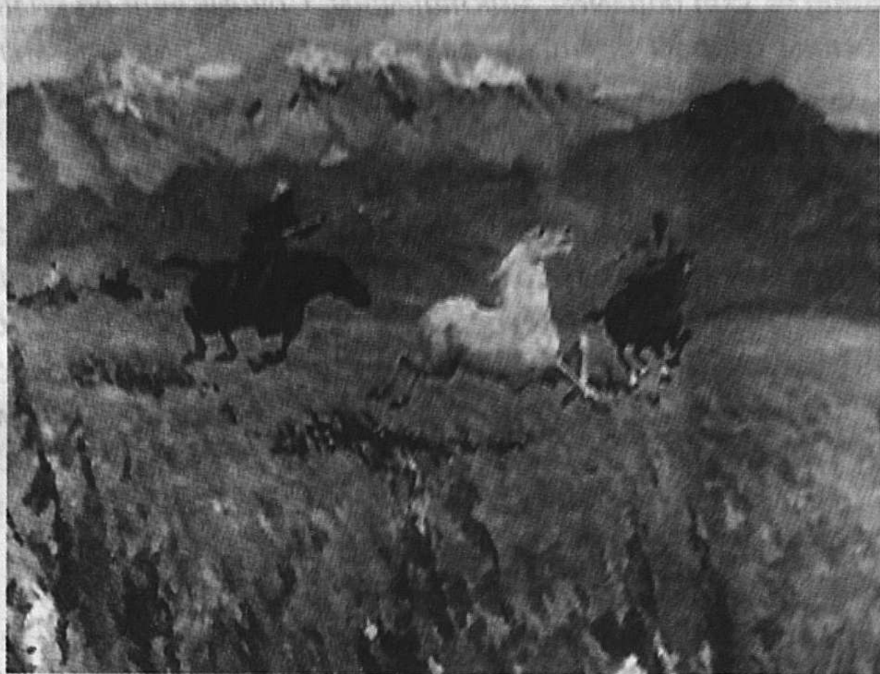
М. Кенбаев. «Қашағанға күрық салу». («Еркіндік»)