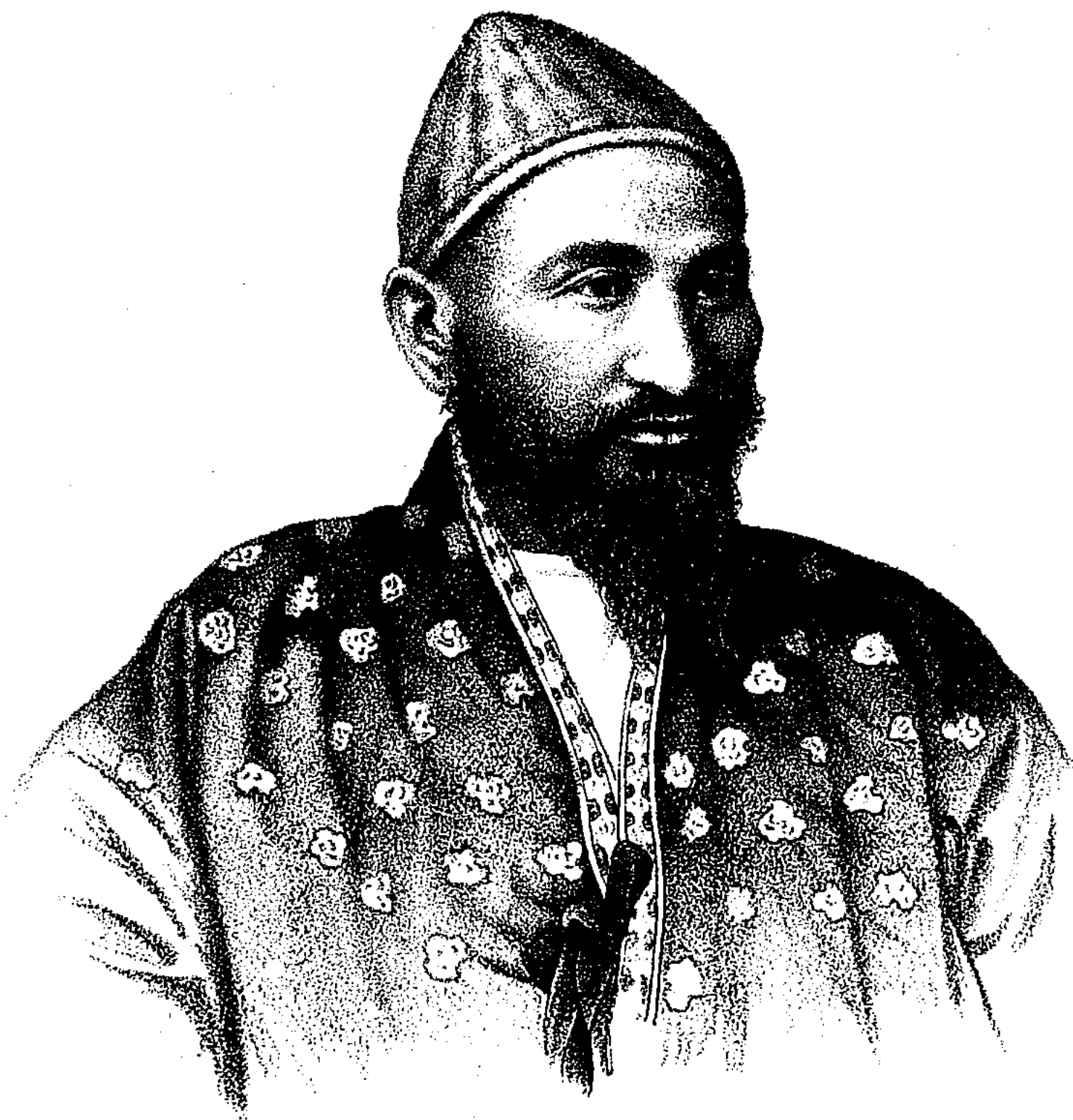
БЪЛАЯ КОСТЬ САДЫКЪ СЫНЪ КЕНИСАРЫ КАСИМОВА