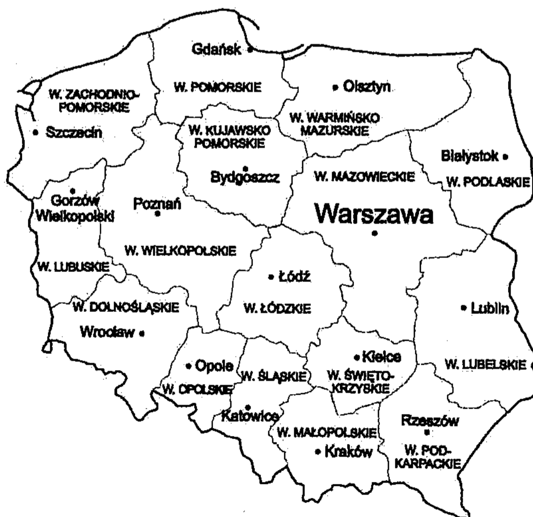
Административная карта ПОЛЬШИ с учетом деления на воеводства

Воеводство – это самая крупная единица территориального деления страны. Руководящими органами воеводства являются: Сеймик воеводства, избираемый на выборах органов самоуправления, а также Правление воеводства. Во главе Сеймика и Правления стоит маршал воеводства. Представителем государственной власти в воеводстве является воевода, который стоит на страже общенациональных интересов.