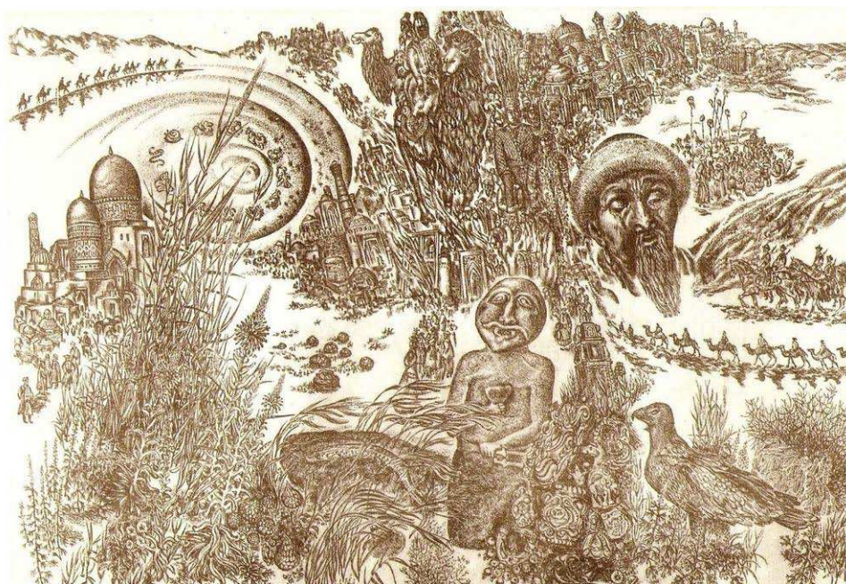
рис. Виктора Поликарпова

План мероприятий международной презентации Национального музея РК «Великий Шелковый путь» Астана, Национальный музей Республики Казахстан 3 – 4 июля 2014 года