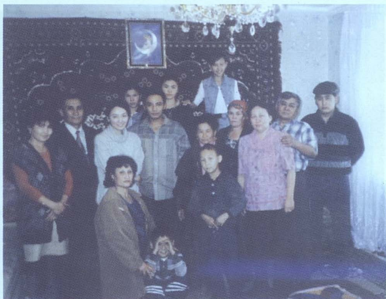
Ерденнің үйлену тойында.