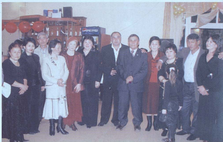
Көршілердің қуанышын бөліскенге не жетсін