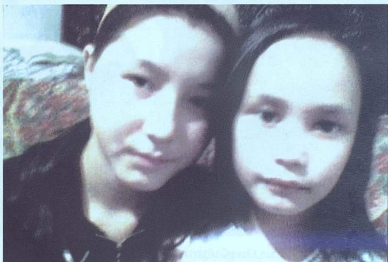
Айсұлу немерем жақын әпкесімен.