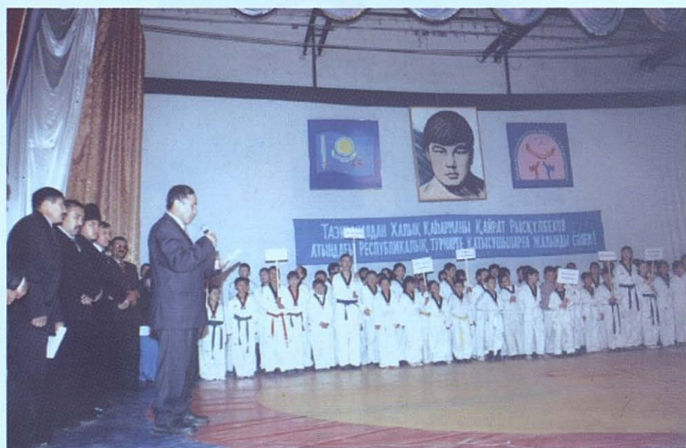
Республикалық турнирдің салтанатты ашылуы.