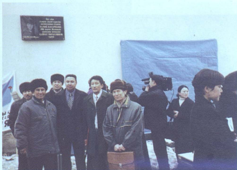
Сәулет құрылыс Академиясының жатақханасына орнатылған тақта тастың ашылу рәсімінде.