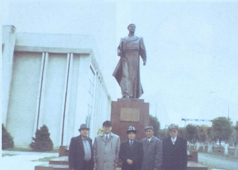
Б. Момышұлы ескерткіші. Тараз қаласы.