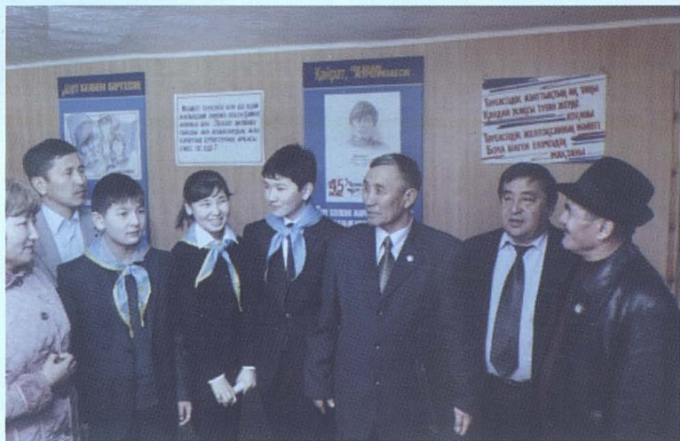
С. Шәкіров орта мектебіндегі Қайраттың мұражай бөлмесінде.