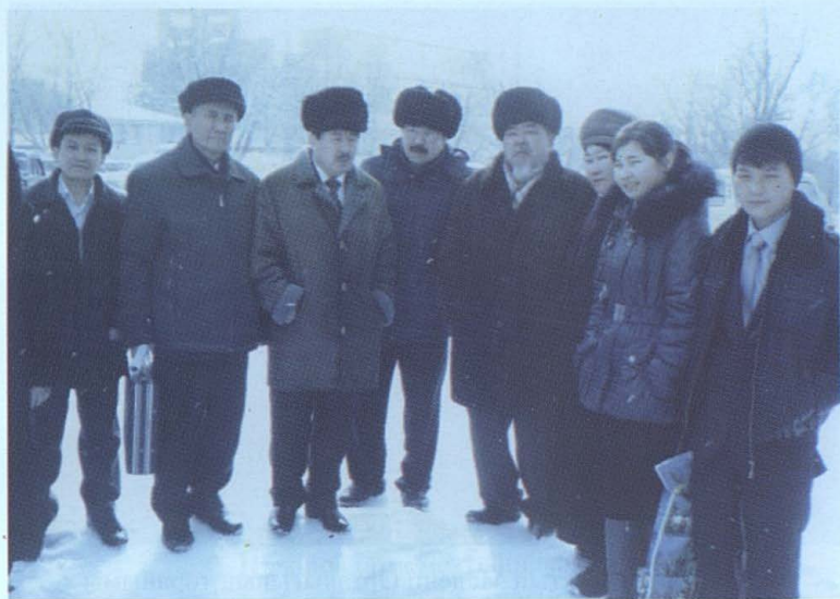
Абай баба ұрпақтарымен.