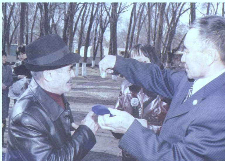
Н. Мадалиевке төс белгі тапсыру сәті.