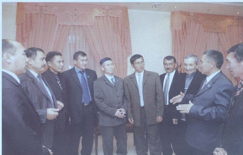
Желтоқсан қаһармандарымен жүздесу.