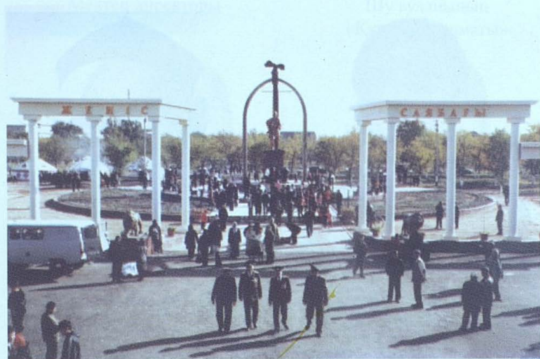
«Жеңіс саябағы». Шу қаласы.