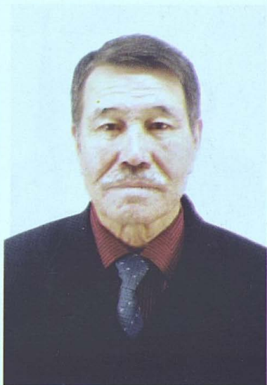
Аяз Бетбаев. Ақын-жыршы, сазгер.