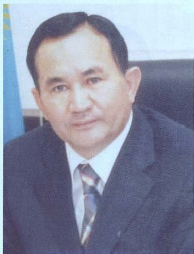
Болат Рысмендиев Мойынқұм ауданының әкімі