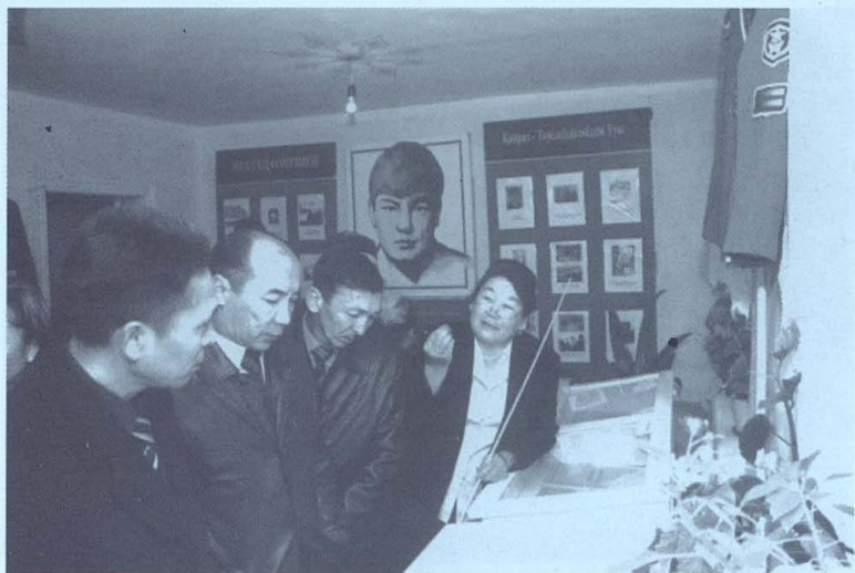
Желтоқсан қаһармандары Қайрат мұражайында.