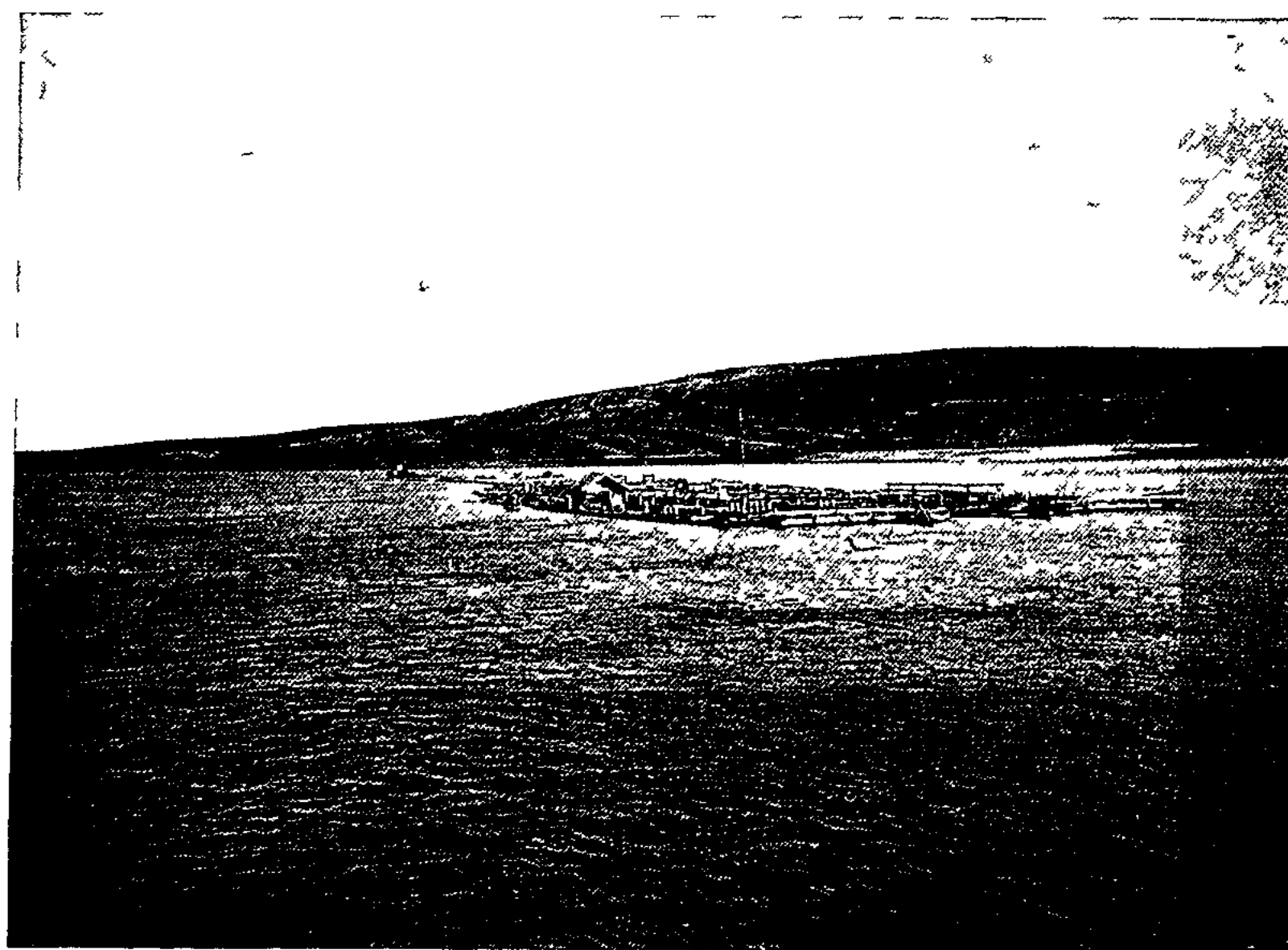
Плоть на Волг .