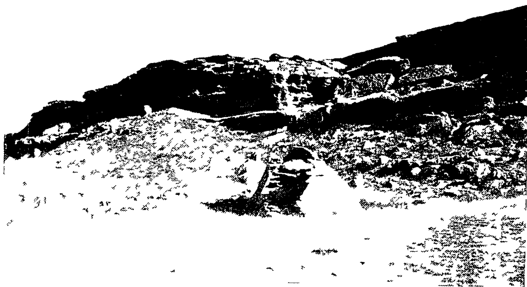
Разрушеше бряя плато