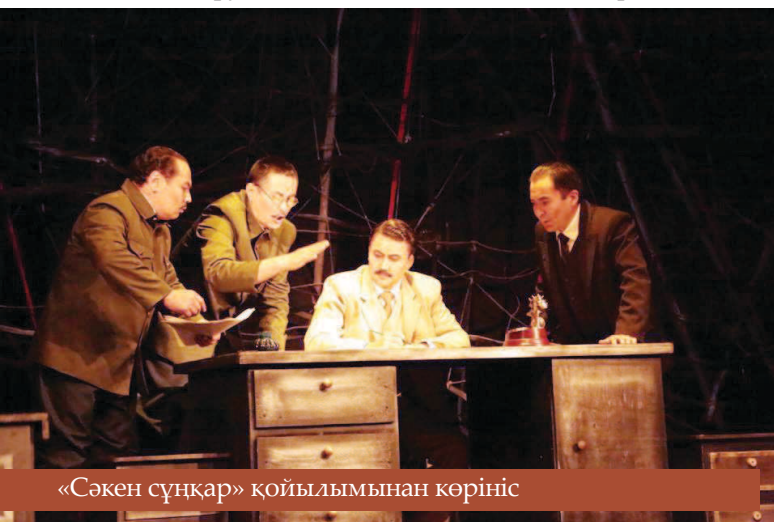
«Сәкен сұңқар» қойылымынан көрініс

– Театр – өнер ордасы. Ол белгілі бір мөлшерде тауар өндіретін зауыт емес. Оның бір ғана жолы, бір ғана мақсаты бар. Халыққа ой салатын, көрерменге серпіліс