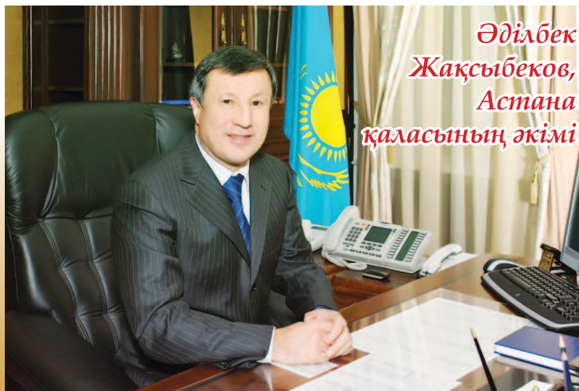
Әділбек Жақсыбеков, Астана қаласының әкімі