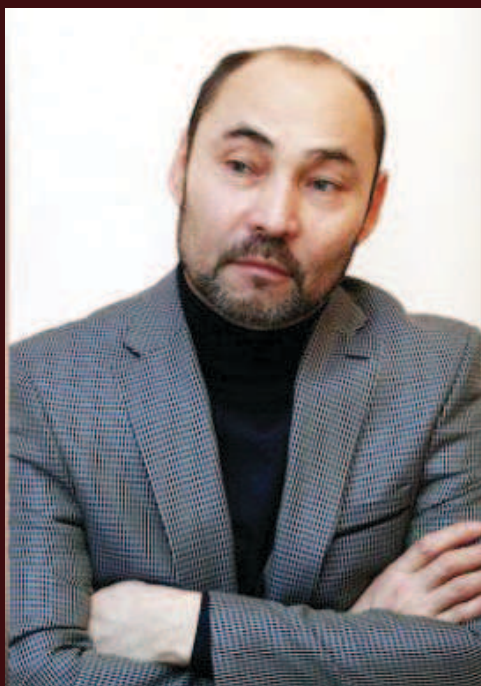
Болат Ұзақов, ҚР еңбегі сіңген қайраткер: