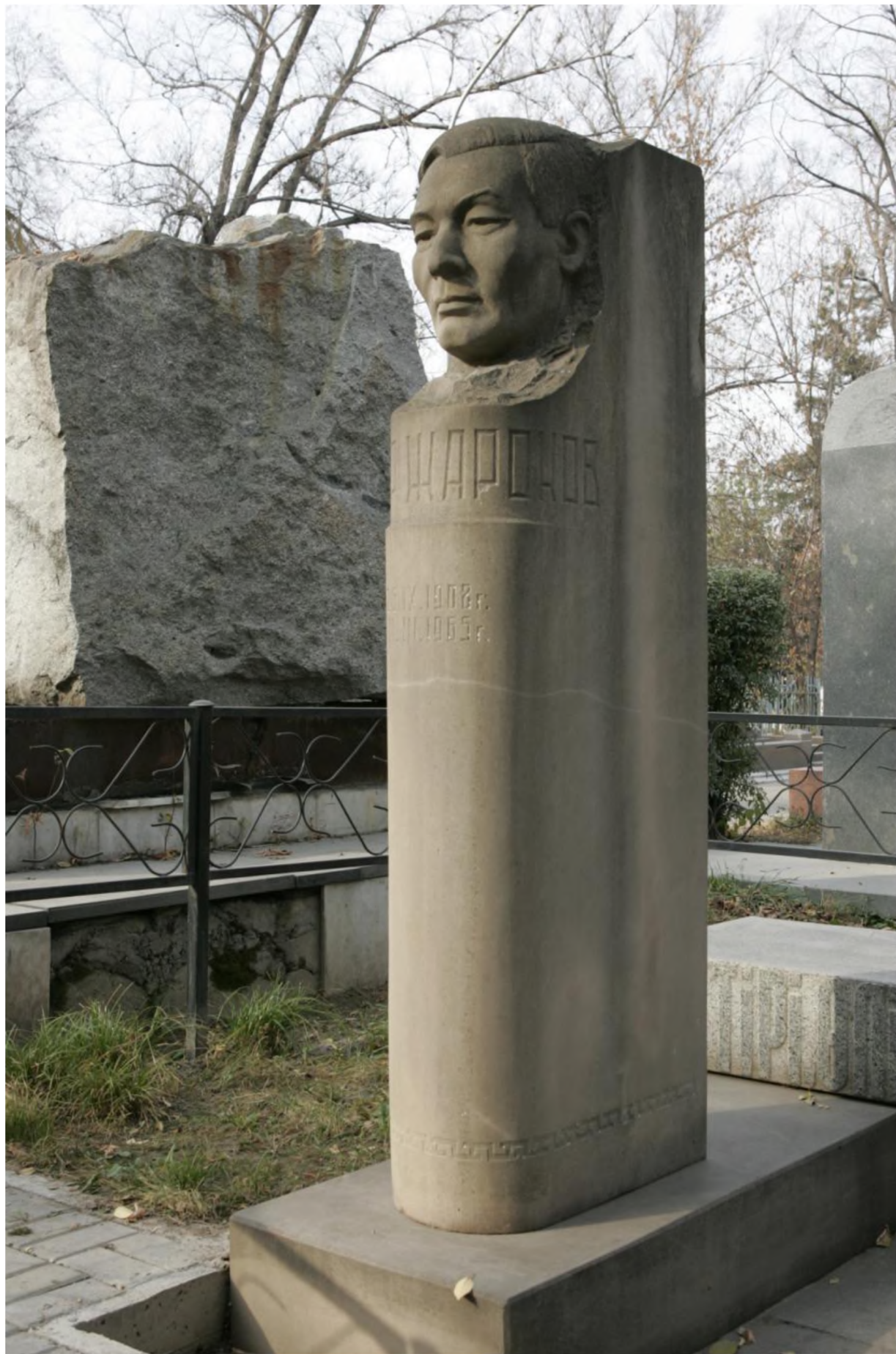
Ил. 4. Памятник поэту Таиру Жаркову.