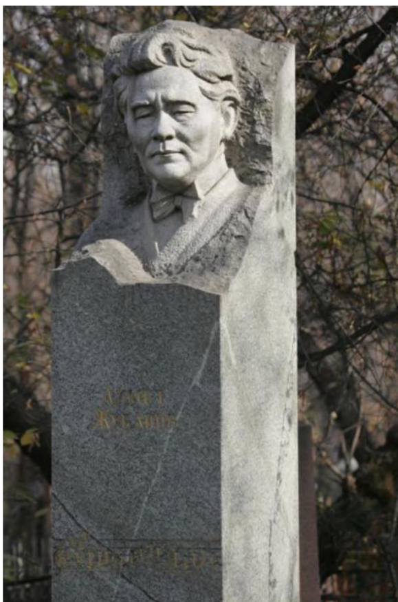
Ил. 3. Памятник народному артисту Казахской ССР Ахмету Жубанову.