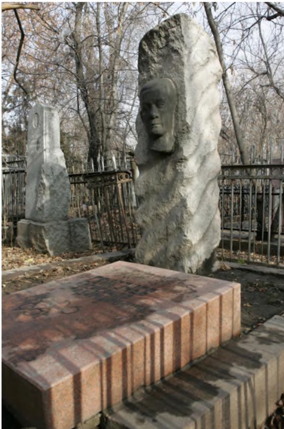
Ил. 5. Памятник народному артисту Казахской ССР Александру Селезневу.