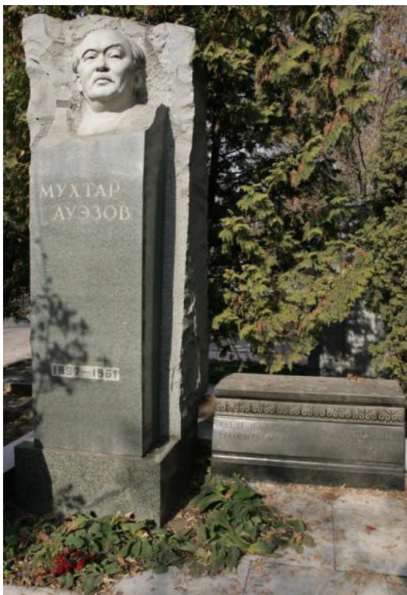
Ил. 2. Памятник академику Мухтару Ауэзову.