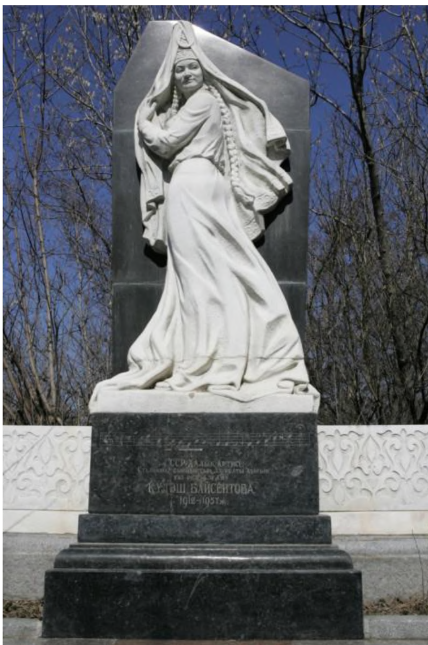
Ил. 1. Памятник народной артистке СССР Куляш Байсеитовой.