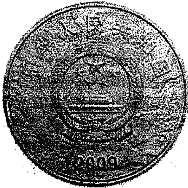
1公斤金质纪念币正面图案

К 60-летию образования Нового Китая выпущены юбилейные монеты