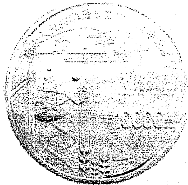
1公斤金质纪念币背面图案

На рисунке: 1-килограммовая круглая юбилейная монета.