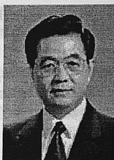
Председатель КНР, Генеральный секретарь ЦК КПК, Председатель ЦВС ЦК КПК Ху Цзиньтао