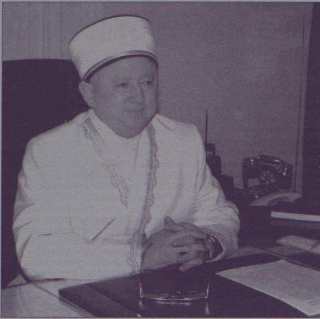
Әбсаттар қажы ДЕРЫСӘЛІ (Қазақстан мұсылмандары діни басқармасының төрағасы, Бас мүфти):