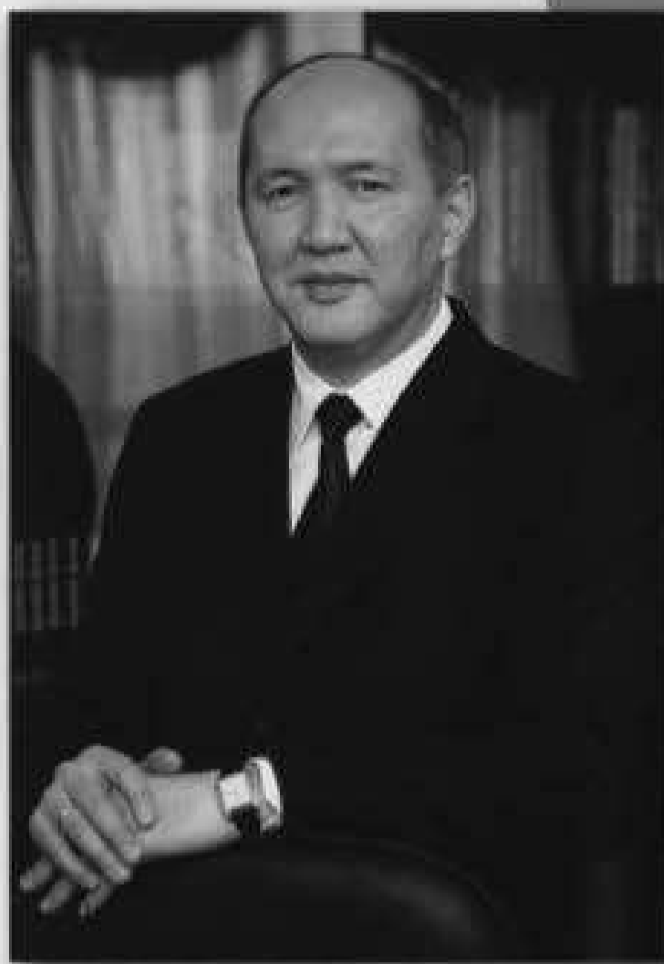
Болатбек ҚУАНДЫҚОВ, Қызылорда облысының әкімі

Тарихымызды түгендеп, салт-дәстүрімізді дәріптеп, бабалардан қалған ұлағатты сөздер мен өнегелі өсиеттерді ұрпаққа жеткізуге өзге мемлекеттермен тереземіз тең, іргелі ел болғанның және Ел Президентінің сарабдал саясаты мен биік ақыл-парасатының арқасында ғана қол жеткіздік. Бүгінгі және келер ұрпақ мұны ешқашан естен шығармауы тиіс.