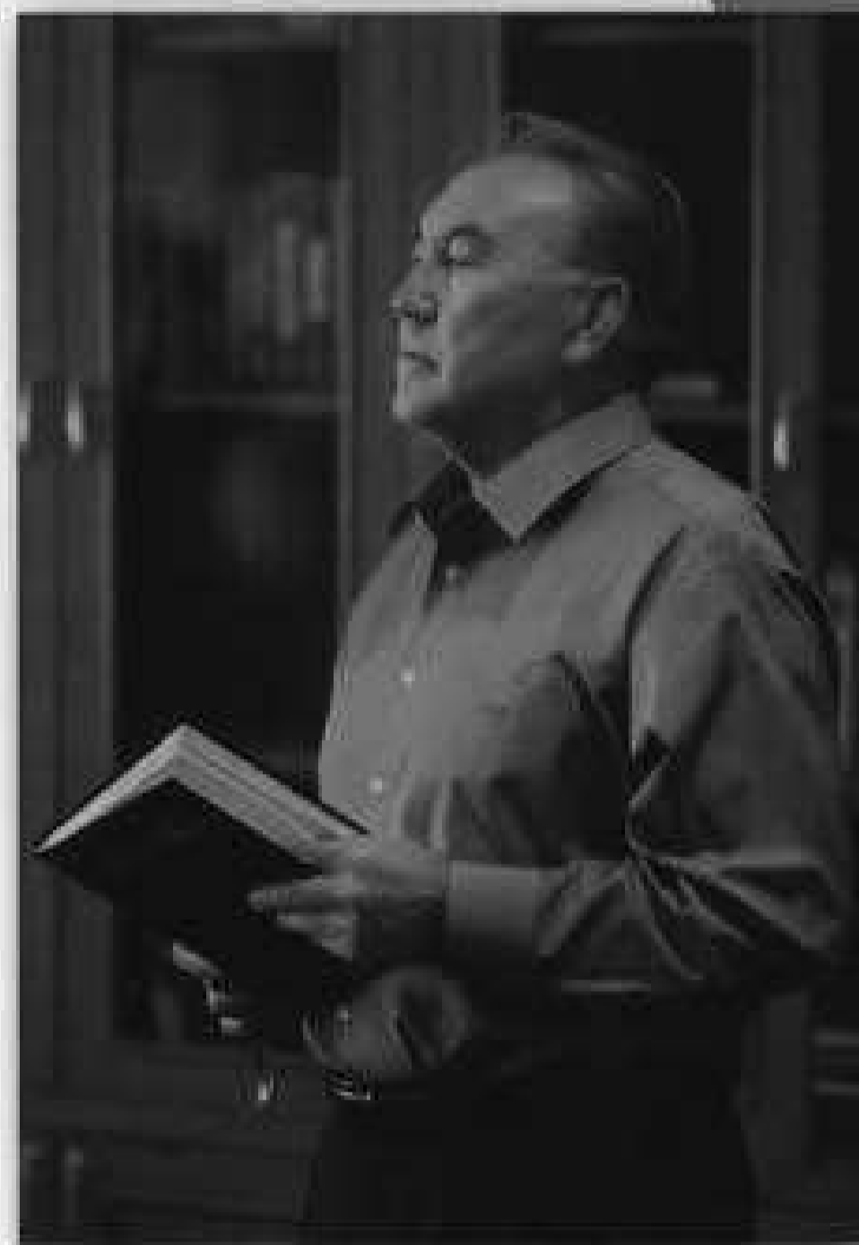
Нұрсұлтан НАЗАРБАЕВ «Тәуелсіздігіміздің бес жылы» Алматы «Қазақстан», 1996 ж.

Үш данағөйдің өнегелі өмірі, ел қамын жеген адал еңбегі, топ бастаған көсемдігі, от ауызды, орақ тілді шешендігі, мүлтіксіз әділдігі жөніндегі айтар әңгіме аз емес. Олардың аузынан шыққан бітімді бата, кесімді баға, ордалы ой, бейнелі теңеу, төрт аяғы тең жорға толғаулар ғасырдан-ғасырға жұрт жадында жатталып бүгінгі күнге жетті. Осынау асыл мұра — билер сөзі кім-кімді де таңдандырмай, тамсандырмай қоймайды.»