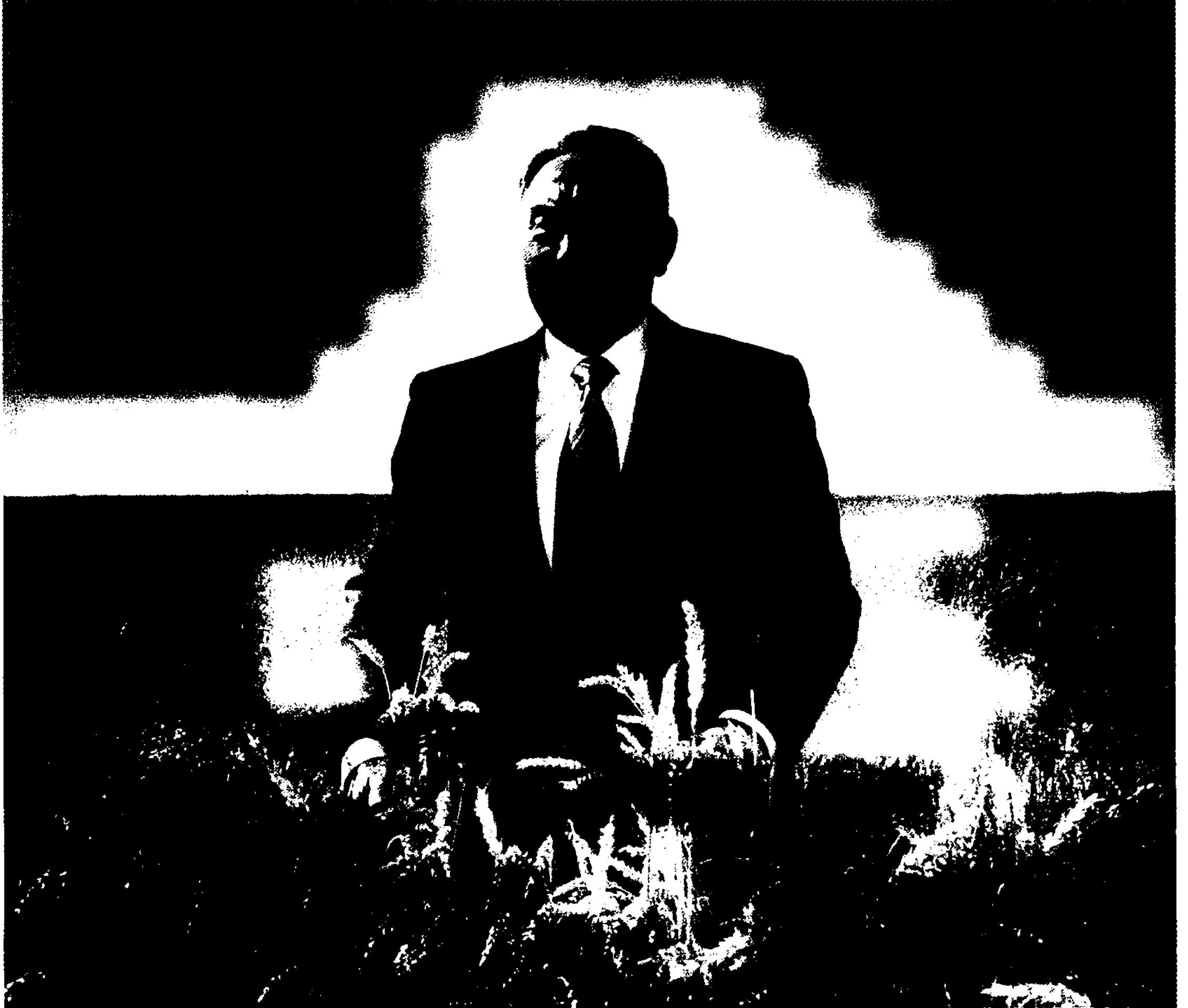
Қазақстан Республикасының Президенті Н.Ә. Назарбаев