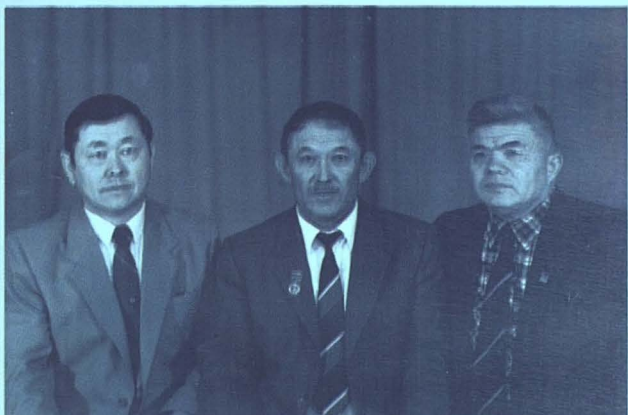
Әйгілі сазгер Шәмші Қалдаяқов және Жолбарыс Сарбасовпен 1987 ж.