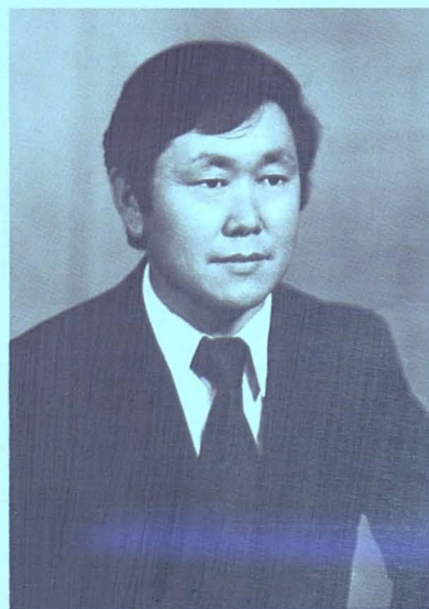
Жалынды жастық шақ. 1973 ж.