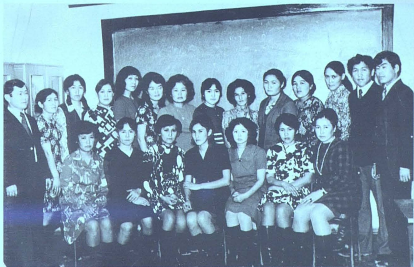
Шымкет пединститутында бірге оқыған курстестар, 1973 ж.