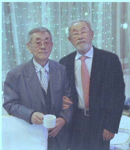
Академик Оразақ Смағұловпен, 2012 ж.