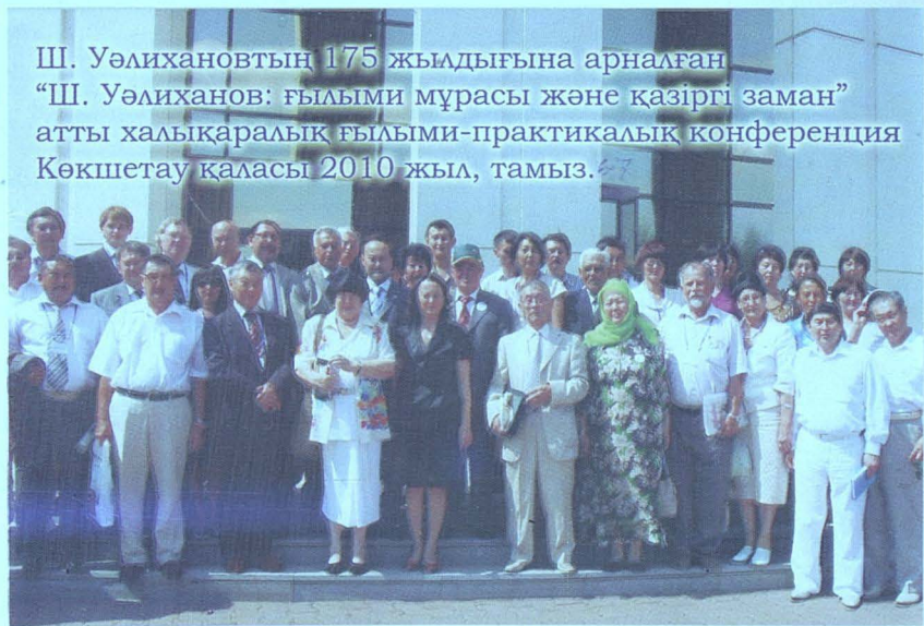
Көкшетау, 2010 жылы тамыз

Ш. Уәлихановтың 175 жылдығына арналған “Ш. Уәлиханов: ғылыми мұрасы және қазіргі заман” атты халықаралық ғылыми-практикалық конференция Көкшетау қаласы 2010 жыл, тамыз.