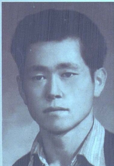
Шынжақ университетінің 4 курс студенті, 1965 ж.