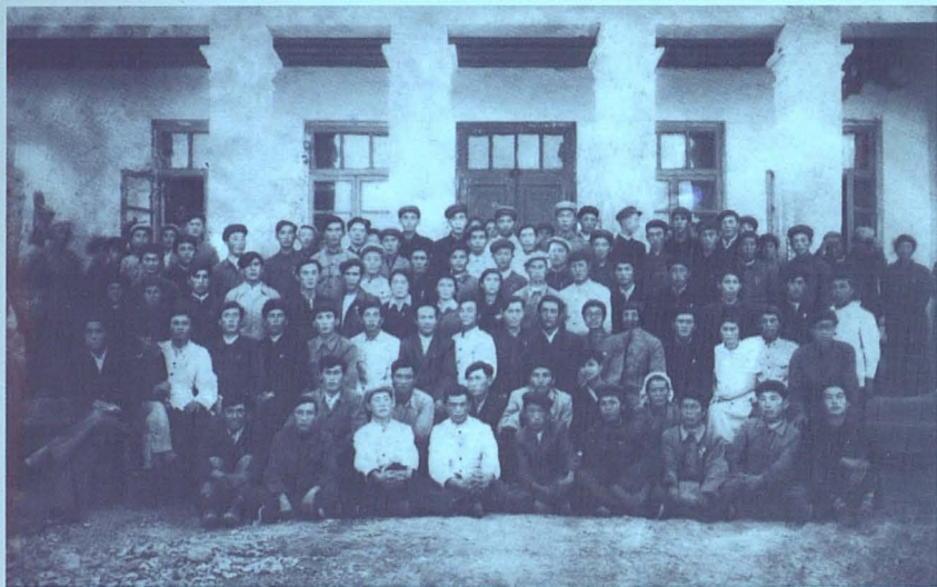
Күнес орта мектебін тәмамдаған жылдан естелік, 1961 ж.