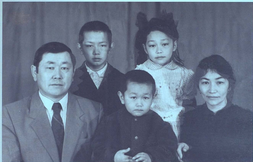
Отбасымен бірге, 1990 ж.