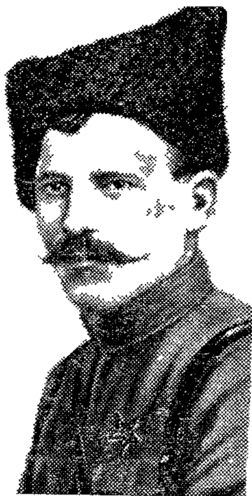
В. И. Чапаев

Совет өкіметі жолындағы күрес Орал қаласына қарағанда Гурьев пен Доссорда біркелкі ұйымшылдықпен өтті, бірақ мұнда да жағдай ауыр болды. 1917 жылдың октябрінде-ақ Орал-Каспий мұнай қоғамы кәсіпшіліктерінде жұмысшылар өндіріс пен бөліске бақылау орнатып, іс жүзінде кәсіпшіліктің қожалары болды. Жұмысшылар буржуазияның мүддесін қорғайтын мастерлер мен басқа да лауазым иелерін қызметтерінен босатты. Бұл жағдай кәсіпкерлердің бәрін дереу жұмысшылармен коллективтік договор жасауына мәжбүр етті 2 . Жұмысшылар Советтер, заводтық және стачкалық комитеттер арқылы мұнай кәсіпшілігі иелеріне өздерінің экономикалық және басқа талаптарын ұсынып отырды. Орал-Каспий мұнай қоғамының басқармасы азық-түлік қорлары жеткіліксіз деген желеумен барлық кәсіпшіліктерде мұнай шығару жұмыстарын тоқтату ниетін көздеді. Жұмысшыларды жаппай жұмыстан шығару қаупі төнді. Жұмысшылар мұнай кәсіпшілік иелерінің бұл зұлымдық айналына наразылық білдіріп, өз мүдделерін 3 қорғау үшін Петроградқа өкілдер жіберді. Гурьев атқару комитеті мұнай кәсіпшілігі жұмысшыларының әділетті талаптарын мақұл-