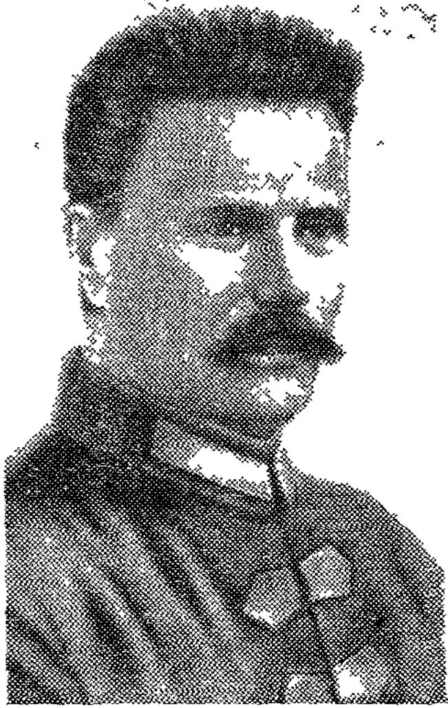
М. В. Фрунзе

Чапаевқа Орал қаласына шабуыл жасауға бұйрық берілді. Бригаданың күші біраз әлсірегеніне қарамастан В. И. Чапаев Оралға батыл шабуыл жасады. Оралдағы ақ казактар командованияесі Чапаевтің жігерлі қимылдарынан сескенип, өз күштерінің басым көпшілігін Чапаевқа қарсы қойып, бригаданы үлкен шығынға ұшыратты. Дегенмен чапаевтықтар тайсалмастан Орал қаласына қарай ілгерілей берді. Олар қалаға жақын жердегі Таловая станицасын басып алды. Ақ казактар командованияесі Орал қаласына тікелей қауіп төнгеннен кейін Чапаевтың бригадасын қоршап алып, жойып жіберуге