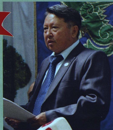
Дүние жүзінің аз және тұрғылықты халықтарының проблемалары бойынша халықаралық конференцияға қатысушылардың алдында сөйлеген сөз. Қырым. 2013 ж.

В настоящее время численность коренных народов во всем мире оценивается в 370 млн. человек, проживающих более чем в 70 странах, что составляет 5% населения планеты. Однако на их долю приходится 15% беднейших слоев населения. Численность коренных народов, проживающих на территории Евразии, более 500 тысяч человек, или 0,3% населения, что подтверждает неутешительные общемиро-