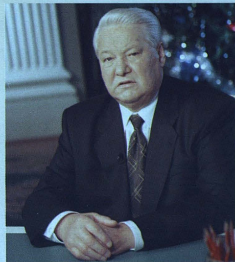
Б. Ельцин, Первый президент России.

Бізде Қазақстанда аз диаспоралардың істерінде олардың ұлттық мәдениеті мен дәстүрлерінің жандануына назар аударылады. Олардың дамуы үшін мемлекеттік қордан қаражат бөлінеді. Ұлттық театрлар, музыкалық, фольклорлық ұжымдар бар. Ұлттық жалпы білім беретін және жексенбілік мектептер жұмыс істейді. Олардың ана тілдерінде газеттер мен журналдар басып шығарылады. Сондай-ақ олардың діни нанымдарының мәселесі де қоғамда ешқандай пробле-