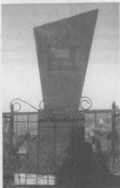
Сейтек Оразалыұлының ескі бейіті