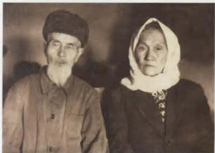
Елеместің ата-анасы Қосалы, Дәріш