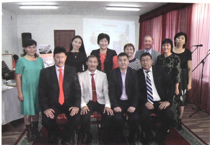
Қапшағайлық әріптестері акындар мен сазгерлердің ортасында