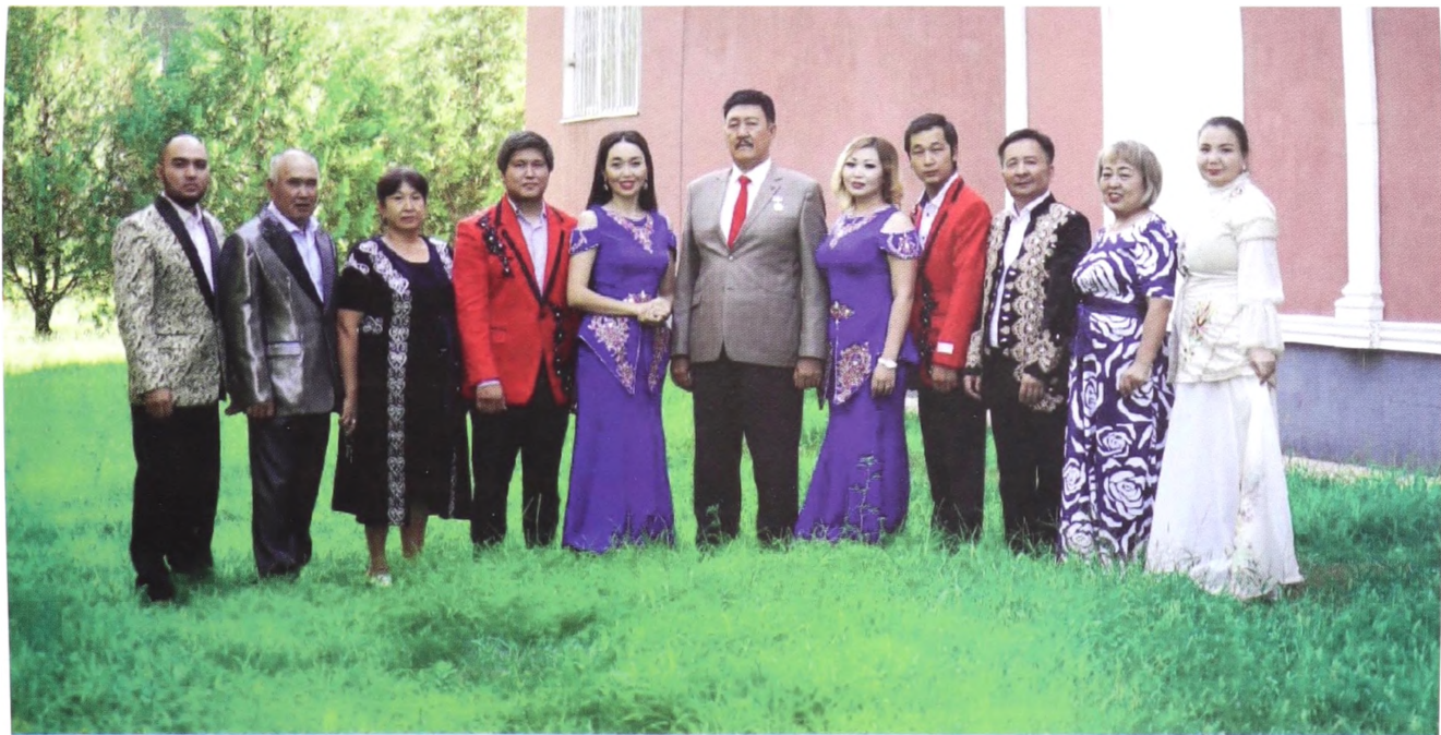
Қапшағай қалалық мәдениет үйінің ұжымы