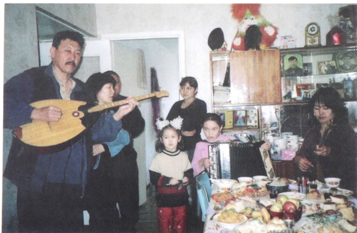
Әр іс-шараның алдында отбасында дайындық болатын