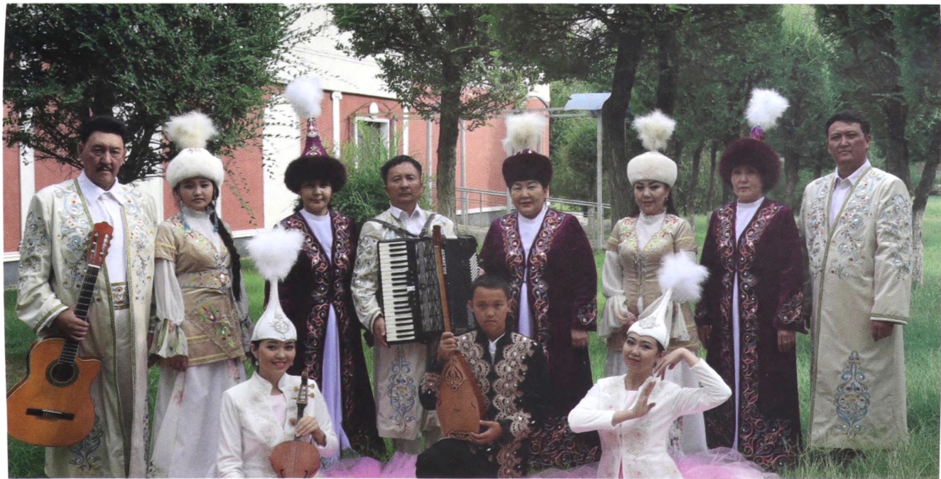
«Шыңғыстау» халықтық - отбасылық ансамблі