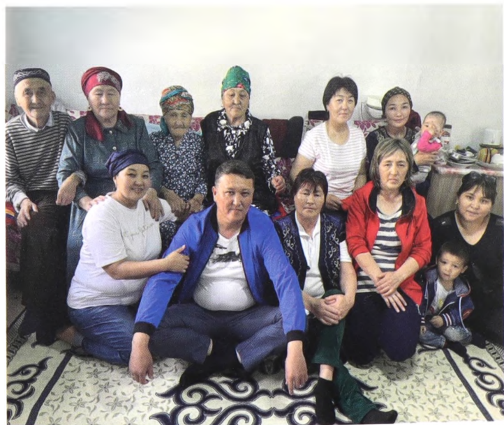
Туыскандар бас косканда