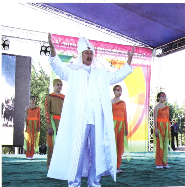
Наурыз тойында Қыдыр баба рөлінде