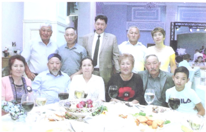
Секен туыскандарынын оргасында