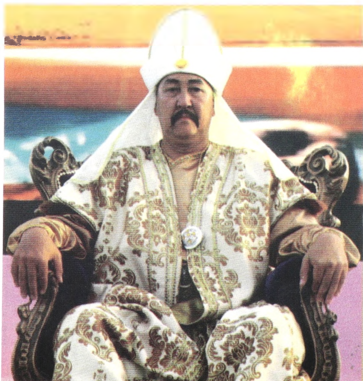
Секең сахна төрінде Керей ханның бейнесін сомдауда