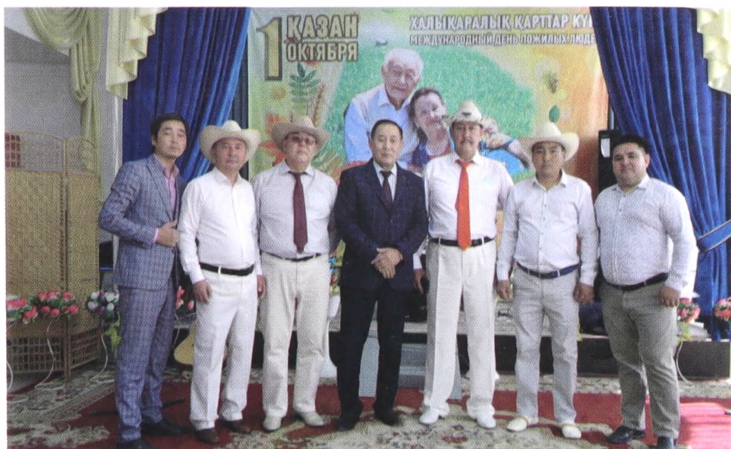
«Қапшағай толқындары» вокалды-аспаптық ансамблі Қапшағай әлеуметтік қызмет көрсету орталығына концерт қоюға барғанда