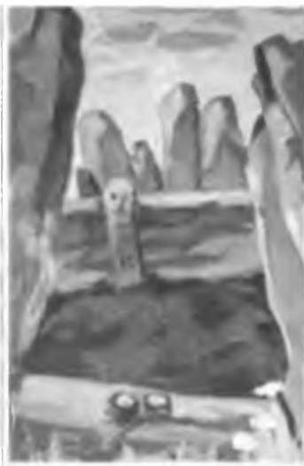
Археология тақырыбына суреттер. Beğazy қорымының көрінісі.