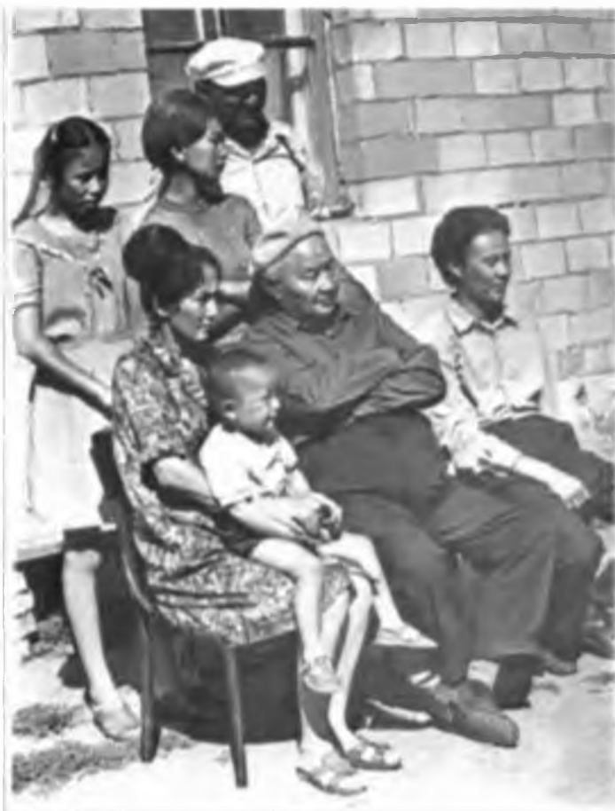
Ә. Марғұлан Қарқаралы ауданы “Восток” кеңшарында (қазіргі Токтар ауылы).