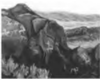
Құлшы тауындағы суреттер. Шұбартау.