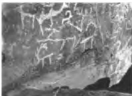
Жылыкөң суреттері. Желтау.