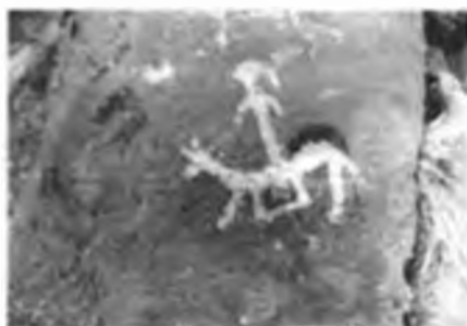
Атқа мінген адам. Желтау.