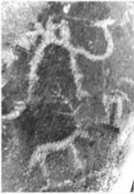
Түйе бейнесі. Желтау.