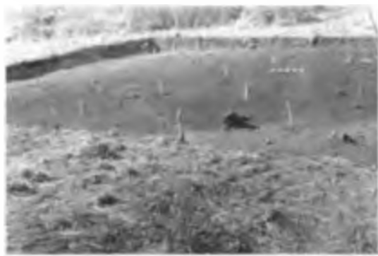
Шортандыбұлақ қонысын қазу сәті. Ә. Оразбаев қазбалары, Шет ауданы.