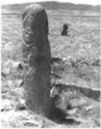
Тас мүсін. Жіңішке бойы. Бесбатыр.