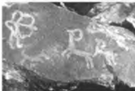
Аншылық композициясы. Қошқар тауы. Шұбартау.