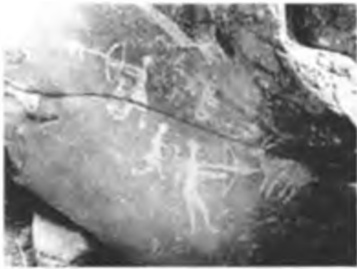
Аңшылар композициясы. Желтау.