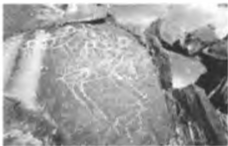
Бұғы бейнелері. Қойтас.