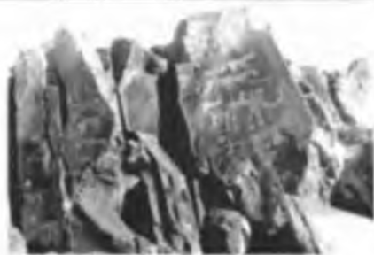
Қошқар тауындағы суреттер. Шұбартау.