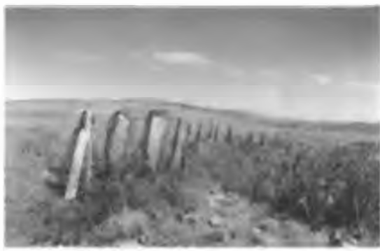
Қорғатай-Нұртай тауы. 37 батыр. Қыпшақтар осы алаңда соғыста қайтыс болған.