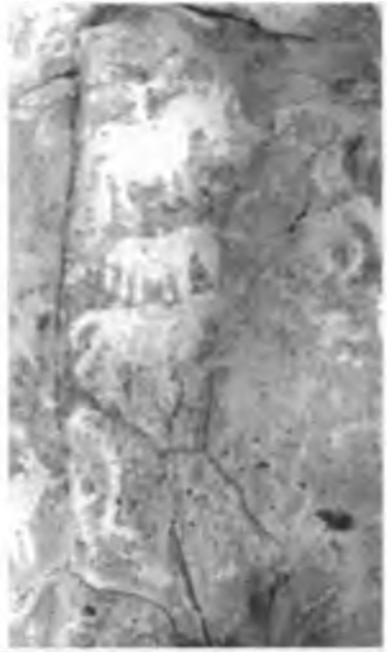
Жылқы суреттері. Қошқар тауы. Шубартау.