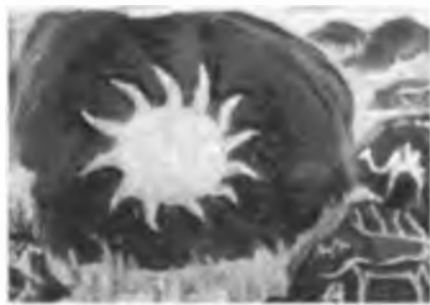
Қытас тауындағы күн бейнесі. Шұбартау.