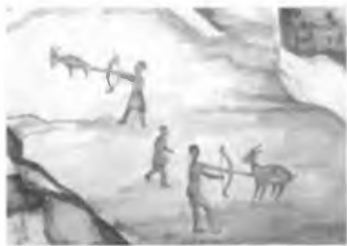
Археология такырыбына суреттер. Қойтас корінісі.