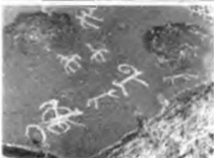
Құлшы тауындағы суреттер.