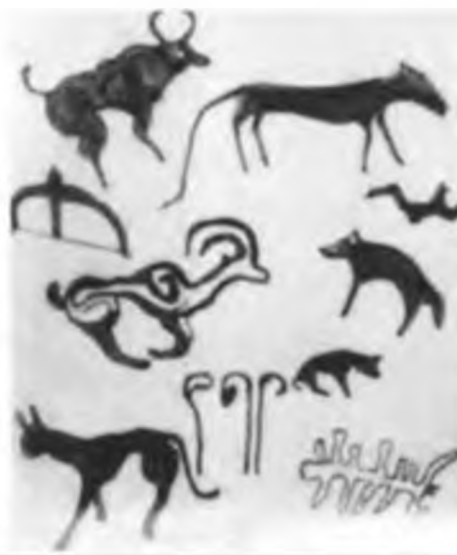
Археологиялық топтама. Саяқ коріністері.