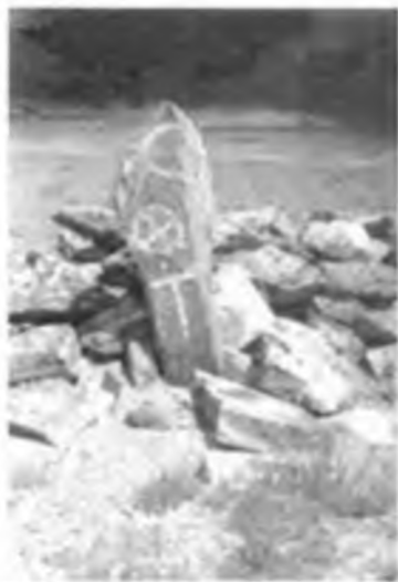
Күн рәмізі, қару бейнеленген құлпытас. Бектауата өлкесі.