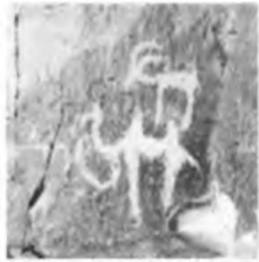
Түйе, таутеке бейнелері. Желтау.