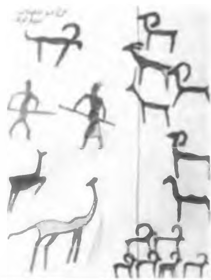
Археологиялық топтама. Теректі коріністері.