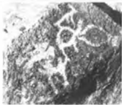
Жылыкөң суреттері. Желтау.