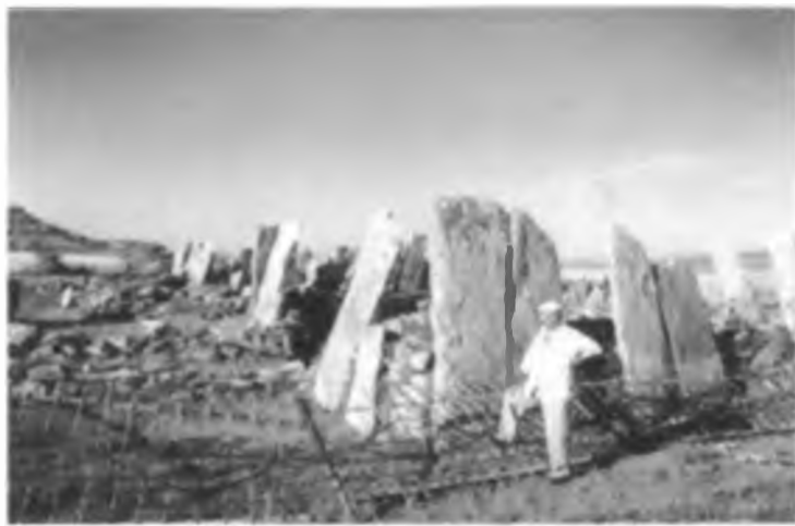
Beğazy қалашығы. А. Мұсатаиұлы