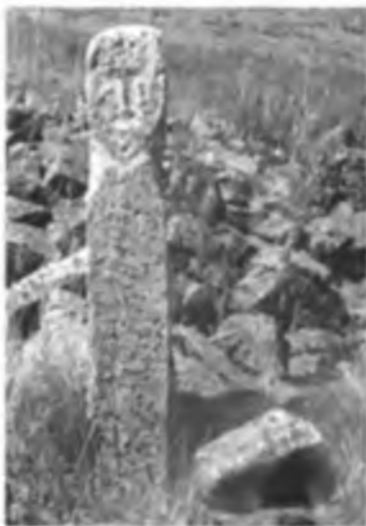
Тас мүсін. Балапан сайы.