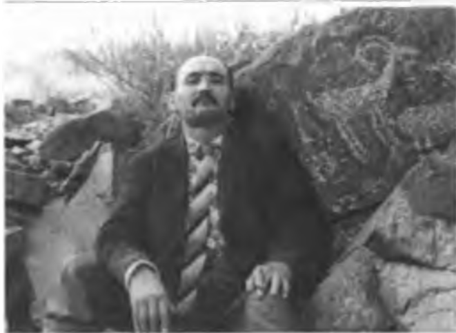
А. Мұсатайұлы таңбалы тастар жанында. Қасым қорас.