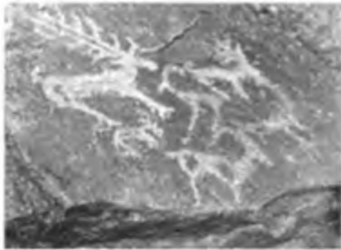
Бұғылар. Жанғұтты өлкесі.