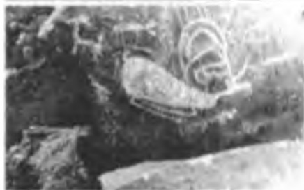
Қошқар тауындағы суреттер. Шұбартау.