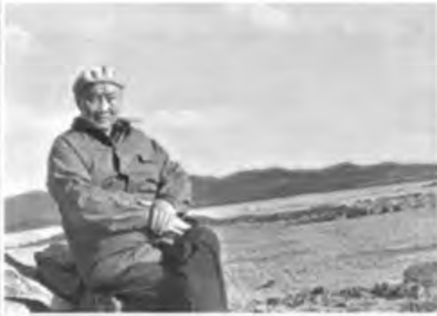
Ә.Марғұлан. Ақтоғай өңірі.