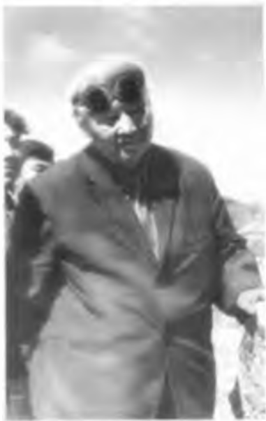
Ә. Марғұлан Бегазы өлкесінде.