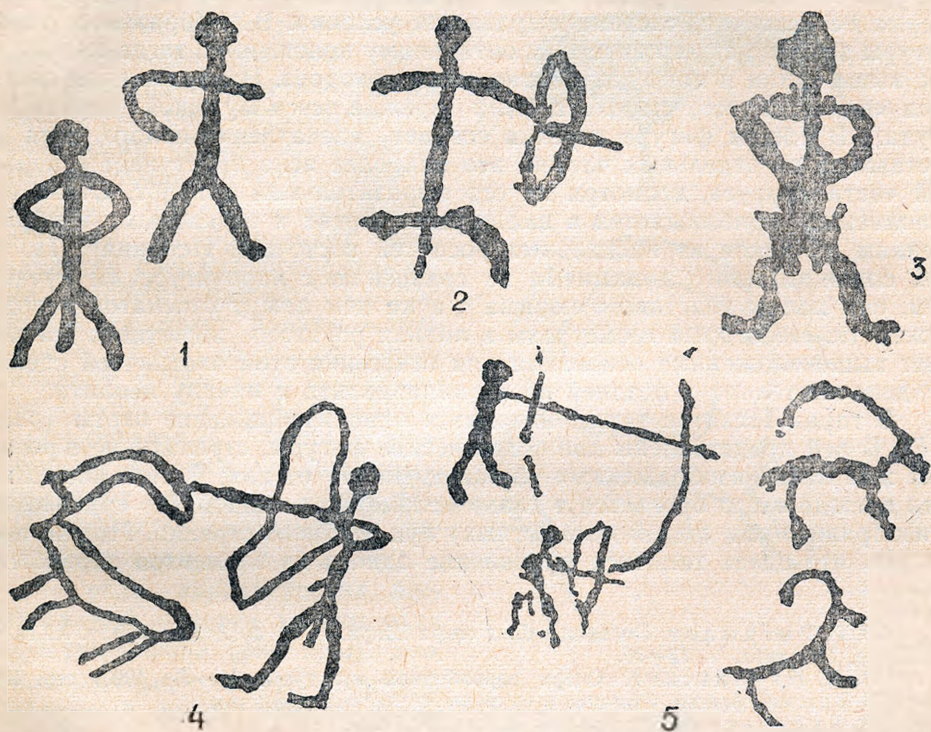
Рис. 1. Наскальные изображения (1/5 нат. величины): 1—две композиционно связанные человеческие фигуры; 2—человеческая фигура с луком и стрелой в руках; 3—человеческая фигура; 4—охотничья сцена; 5—групповая охотничья сцена.

Знакомство с фигурами людей, выполненных на скалах Северного Прибалхашья, еще раз подтверждает, что у первобытного искусства «нарастание стилизации всего резче проступает в изображениях человека» 3 . Сопоставление их с одновременными им изображениями животных подтверждает это явление. К типичным примерам схематизма и условности принадлежат стилизованные изображения двух человеческих фигур, выщербленные на скалах в горах Караунгур (рис. 1, 1). Они представ-