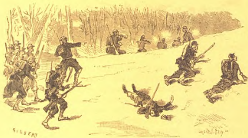
Геройская смерть Густава Ламбера.

Во время бѣдственной франко-прусской войны 1870 года наука