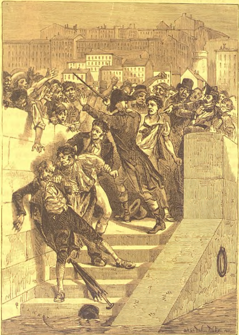
Нападеніе ткачей на Жакара.

ему кромѣ того получать пятьдесятъ франковъ за каждый станокъ его изобрѣтенія.