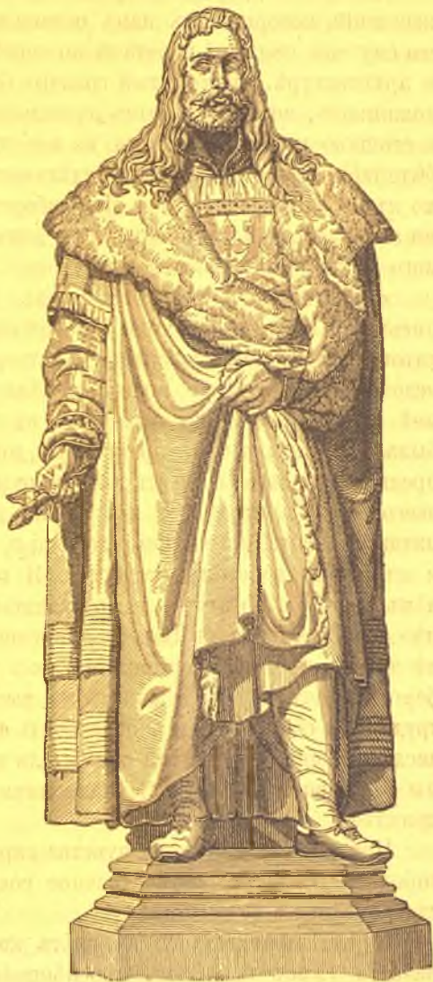
Статуя Дюрера въ Нюренбергѣ.

Одновременно съ книгопечатаніемъ явилось на свѣтъ и гравированіе; искусство соединилось съ наукой, чтобы поднять уровень человѣческаго знанія. Почти въ то самое время, какъ умеръ Гутенбергъ, явился Альбрехтъ Дюреръ. Онъ родился въ Нюренбергѣ въ 1471 году, въ эпоху, когда гравированіе на деревѣ только-что начало распространяться. Съ юныхъ еще лѣтъ онъ скитался по Нидерландамъ, родинѣ первыхъ граверовъ, былъ въ Венеци, гдѣ гремѣла слава предшественниковъ Тиціана, посѣтилъ Вѣну и здѣсь приобрѣлъ расположеніе извѣстнаго соперника Людовика XI и Карла VIII—германскаго императора Максимилиана I. По истинѣ можно сказать, что Альбрехтъ Дюреръ силой своего генія влагалъ жизнь въ дерево. Любовь матери свѣтится въ величественныхъ образахъ его Мадоннъ; воодушевленіе сверкаетъ и искрится въ торжественныхъ триумфальныхъ сценахъ; ужасомъ вѣетъ отъ его «Апокалипсиса»; его произведенія