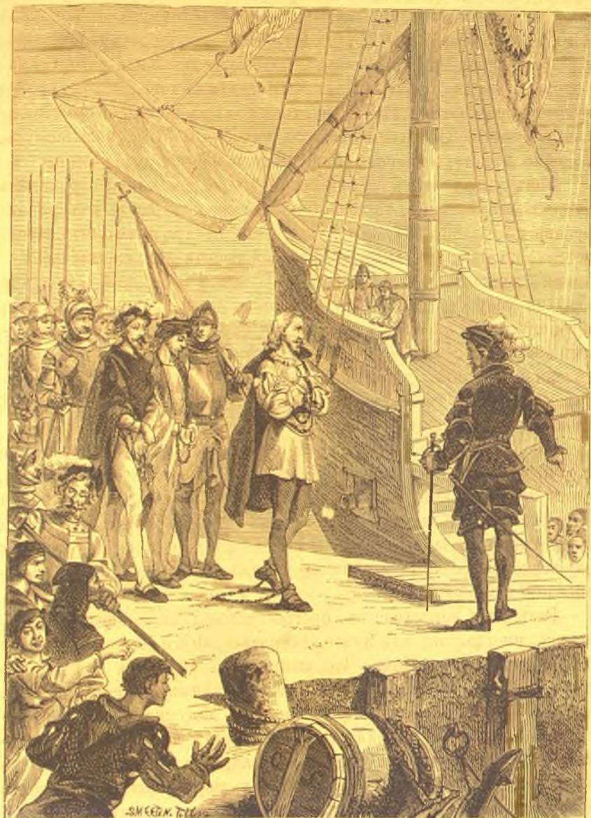
Колумбъ въ цѣвяхъ.

торый, повидимому, долженъ былъ разбиться. Экипажъ возмутился