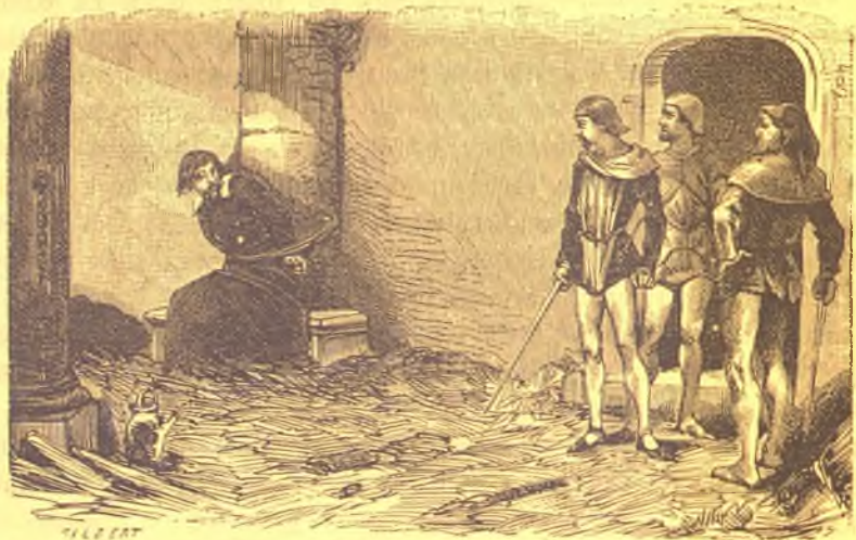
Альдо Манучи въ темницѣ.

современниковъ безъ хорошихъ книгъ по части науки и литературы». Альдо Манучи сдержалъ свое обѣщаніе, и въ теченіе восьми лѣтъ сряду неутомимо и страстно отдавался дѣлу изданія лучшихъ произведеній древняго міра. Бѣдствія, неразлучныя съ войной, опустошавшей тогда Европу и въ особенности Италію, довели, въ 1506 году, его типографію до того, что она должна была совершенно прекратить работу. Унаслѣдовавъ притязанія французскаго королевскаго дома на Неаполитанское королевство, Людовикъ XII заключилъ союзъ съ Фердинандомъ-Католикомъ съ цѣлью изгнать Фридриха III, и рѣшился завладѣть Генуей и Венеціей.