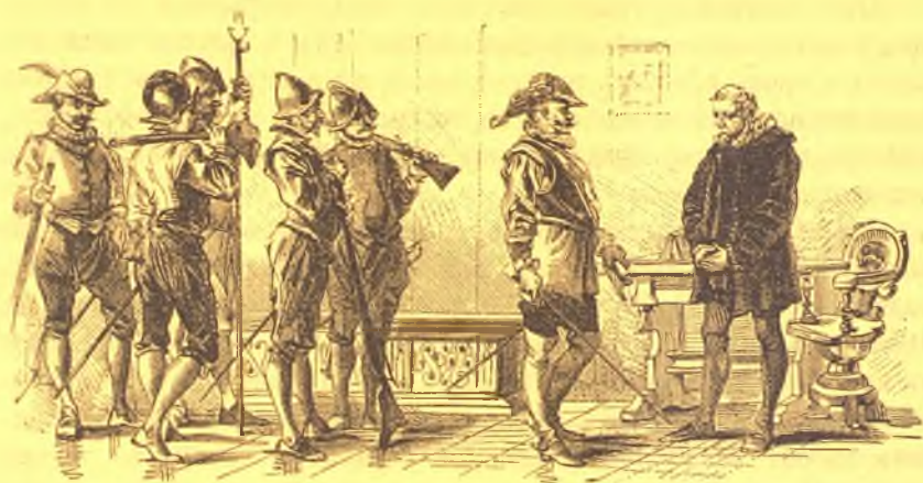
Арестованіе Джордано Бруно.

Если Ванини не имѣть права на уваженіе потомства, а заслуживаетъ состраданіе только вслѣдствіе жестокой казни, которой онъ былъ подвергнутъ, то нельзя сказать того же самаго про уроженца Калабріи, знаменитаго Кампанеллу. Кампанелла родился въ 1568 году и 14 лѣтъ отъ роду вступилъ въ монашескій орденъ доминиканцевъ. Онъ питалъ страсть къ труду, любовь къ наукѣ и обнаруживалъ истинное стремленіе къ добру. Обладая смѣлымъ и независи-