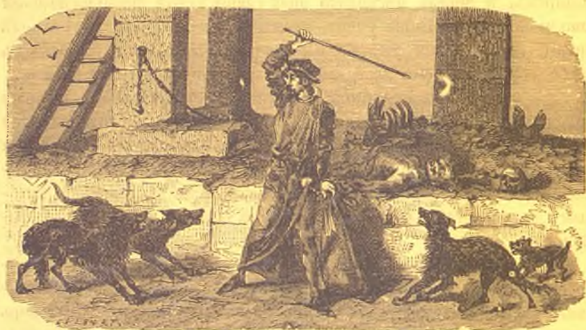
Везалій, добывающій себѣ трупы для анатомірованія.

Къ числу мучениковъ науки принадлежитъ и великій Гарвей (род. въ 1578 г. въ Фолькстонѣ, въ Англіи), которому физиологія обязана открытіемъ законовъ циркуляціи крови. Геній не гарантировалъ его ни отъ насмѣшекъ, ни отъ вражды современниковъ. Когда онъ издалъ сочиненіе о большомъ кровообращеніи, то высказанныя имъ новыя мысли, хотя и основанныя на многочислен-