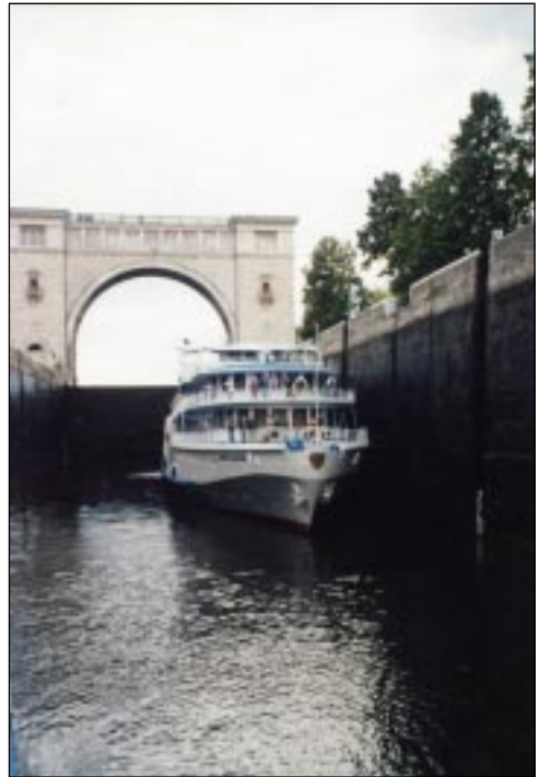
Шлюз канала Москва — Волга.

8 августа 1941 года Георгий Эфрон записывает в дневнике: «Нахожусь на борту «Александра Пирогова», который плывёт по каналу Москва — Волга. После трагических дней — трагических, главным образом, из-за отсутствия конкретных решений и почти фантастических изменений этих решений, после кошмарной погрузки на борт мы, наконец, отчалили. ... Всего путешествие продлится 8 дней. Окончательное место назначения город Елабуга, на реке Каме. ... Довольно паршиво, но всё, что я мог