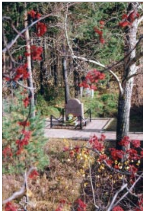
Могила Марины Цветаевой в Елабуге.