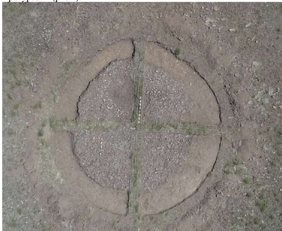
Рис. 1. Общий вид каменной конструкции кургана Бирлик I

При исследовании кургана оставлены стратиграфические разрезы (бровки) по линии С – Ю и З – В, шириной 0,5 метра. Ровные края бровок вывести не удалось, в силу плотного залегания мелких камней. Сама наброска выполнена из мелкого колотого плитняка. Размеры камней в среднем 10 x 10 см. Крупные валуны, располагающиеся по кругу, размерами примерно 50 x 30 см, образуют схематический круг. После расчистки кургана и полной круговой фотофиксации по секторам, ведущейся с севера и далее по часовой стрелке, по кругу, была проведена съемка кургана с квадрокоптера с разных высот и под различными ракурсами (рис. 1).