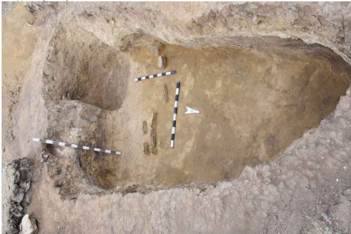
Рис.2. Могильная яма кургана Бирлик I

Первоначально, небольшое могильное пятно находилось в северо-восточном секторе, было вытянуто по линии С – Ю, неправильной овальной формы. На глубину до 50-60 см была сильно забита провалившимися с поверхности камнями. Дальнейшая расчистка могильной ямы выявила ее общие контуры – вытянутая по линии Север – Юг, неправильной формы. Длиной порядка 5 м 30 см, максимальной шириной в средней части 2 м 70 см. Остатки костей скелета, сильно крошащиеся, располагались в средней части могильной ямы, по линии З – В, головой на запад, с небольшим отклонением к югу. От черепа остался только тлен. Частично сохранились трубчатые кости левой ноги, локтевая и лучевая кости левой руки. Остальные кости прослеживались рассыпающимся тленом. Скелет располагался на органической подстилке светло-серого цвета, вероятно, войлочного происхождения (Рис.2).