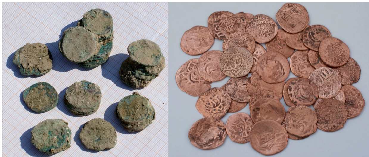
5-сур. Бұзықта жүргізілген қазба кезінде табылған мыс теңгелер