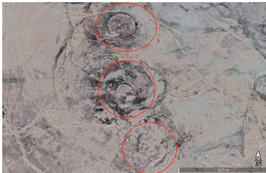
4-сур. Аркук қаласы орындарының космостан түсірілген фотосы

Сонымен Артықата I қалашығы осы күнгі Көктөбе ауылынан оңтүстік-батысқа қарай 2 км жерде жатыр. Қалашықтың орталық бөлігі