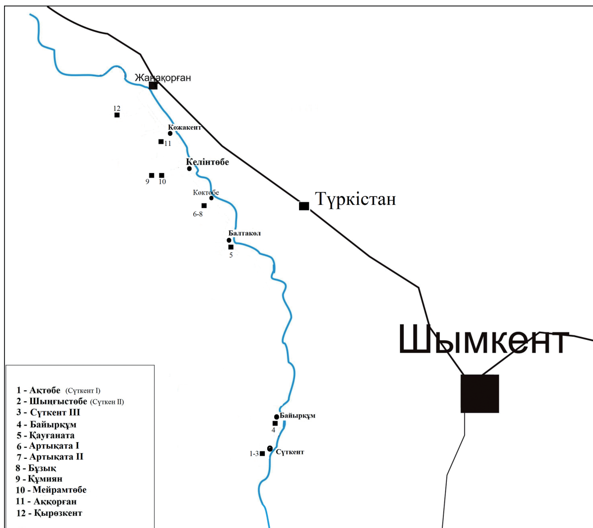
1-сур. Сырдарияның сол жағалауындағы ортағасырлық қалалардың орналасу картасы

Сүткент. Сырдарияның сол жағалауындағы Сүткент қаласы туралы X–XV ғғ. аралығындағы араб, парсы тілінде жазылған деректерде аз да болса кездеседі. Қала туралы алғаш X ғ. өмір сүрген