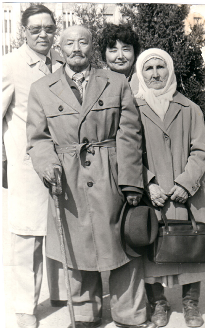
Ата-анам 1 мамыр мерекесі. Орал қаласы, 1982 ж.