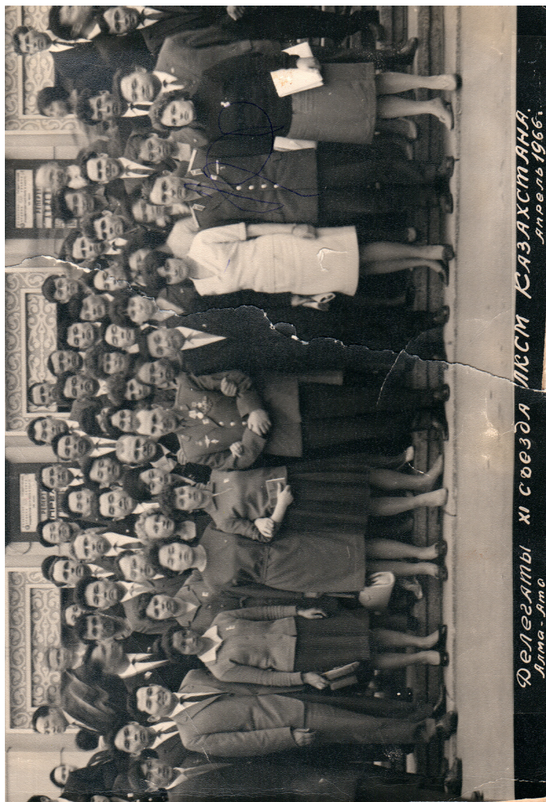
Қазақстан ЛКСМ 11 съезінің делегаттары сәуір 1966