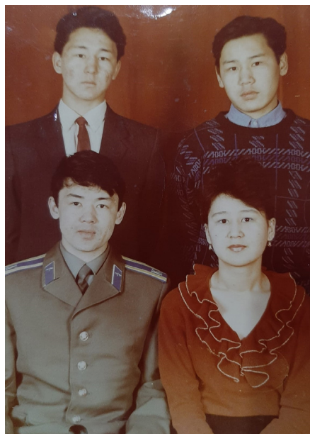
Орал қаласы, 1990 жыл