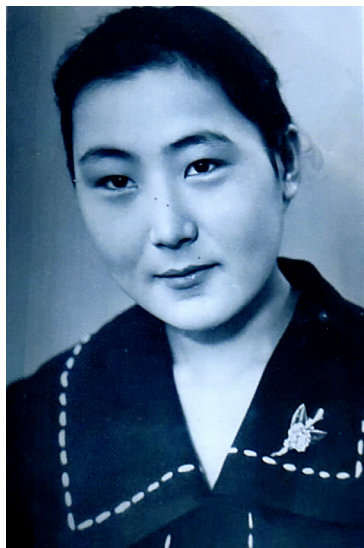
Батыс Қазақстан ауыл шаруашылығы институтының 3-курс студенті 1964 жыл Орал қаласы