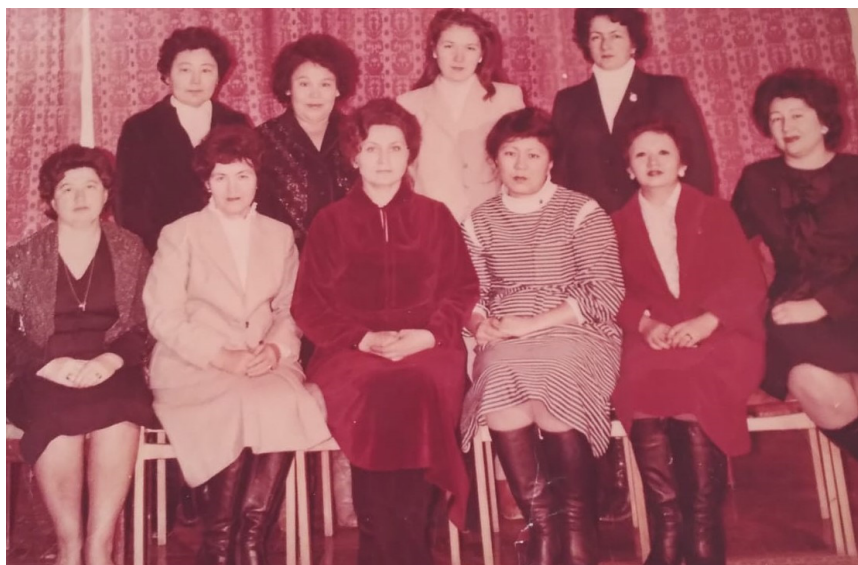
Орал облыстық Кәсіподақ конференциясы. 1975 ж.