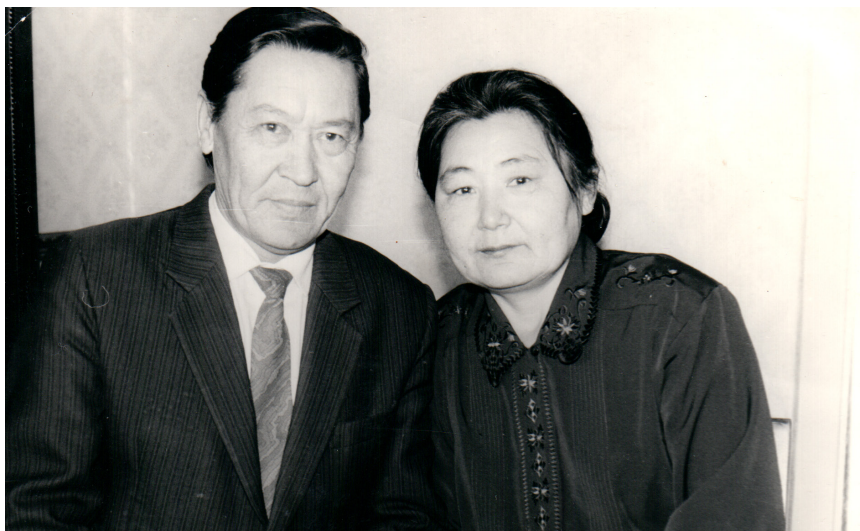
Дайыр - Бақыт