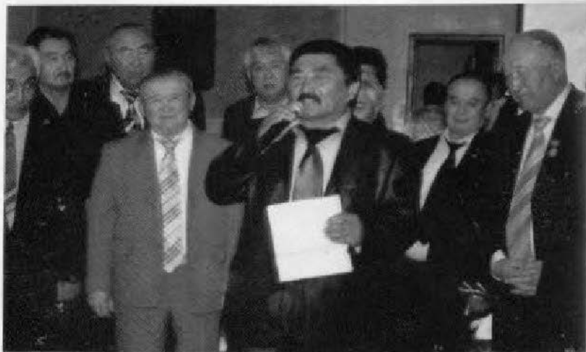
Армындатып ак өлең оку.