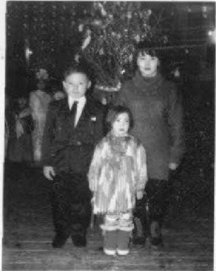
Алқанның ұлы мен қыздары.