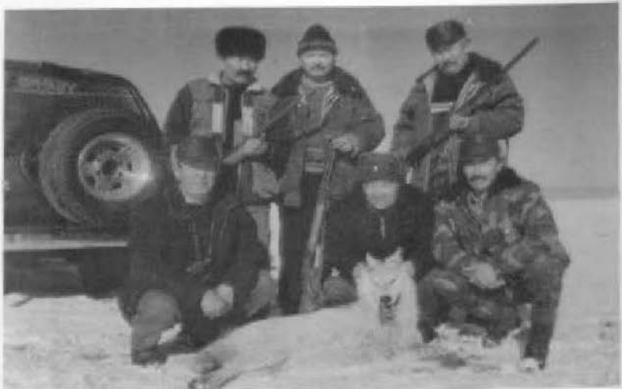
Салбурын, Көкжал алу.