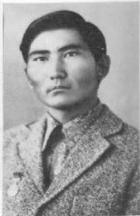
Кайран жиырма бес!