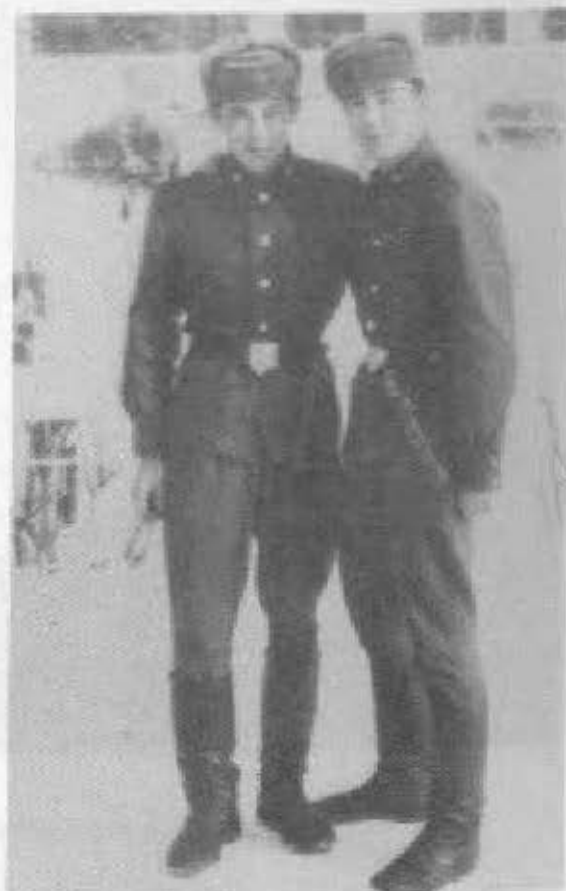
Солдан: Тұман досы. Жекен.