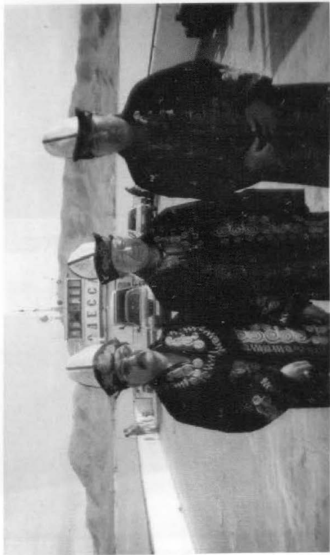
Әйгілі Алтайдын Бұқтырма паромы үстінде.