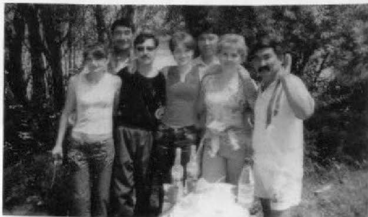
Іле жағасы — жан тынысы.