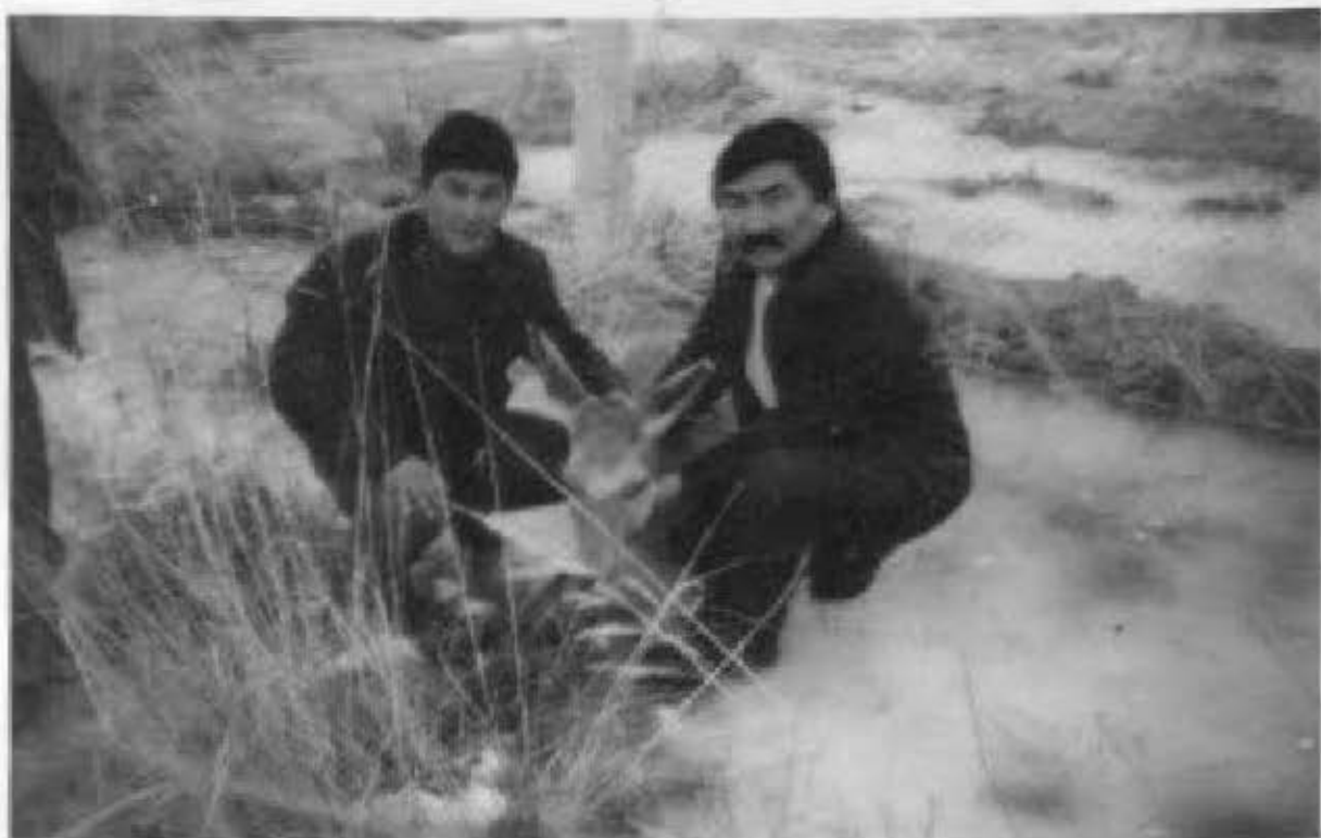
Алтын Емел аясында Ерікпен.