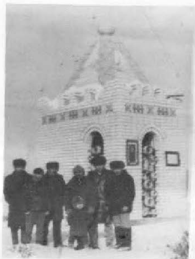
Анасы Исабала күмбезі басында.