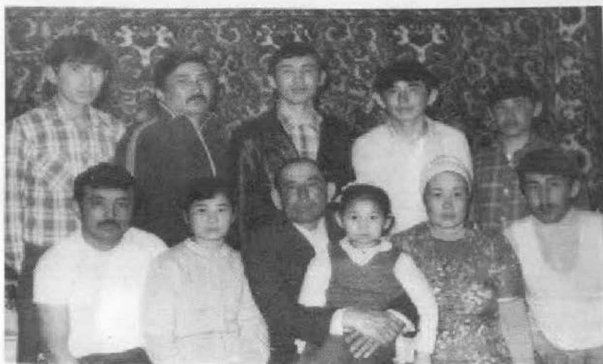
Тойшыбайдан тараған әулет.